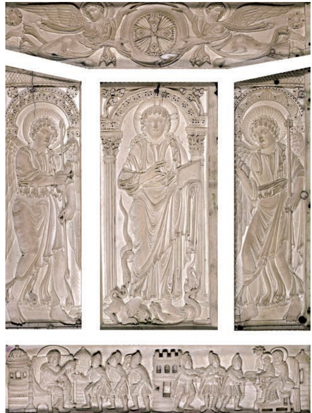
6 Ευαγγελιστάριο του Lorsch , c. 810, Bibliotheca Apostolica, Βατικανό. α. Recto, Η Παναγία με το Βρέφος ένθρονη και Η Γέννηση του Χριστού , Victoria and Albert Museum, Λονδίνο β. Verso, Ο Χριστός ανάμεσα σε δύο αρχαγγέλους και Η Προσκύνηση των Μάγων