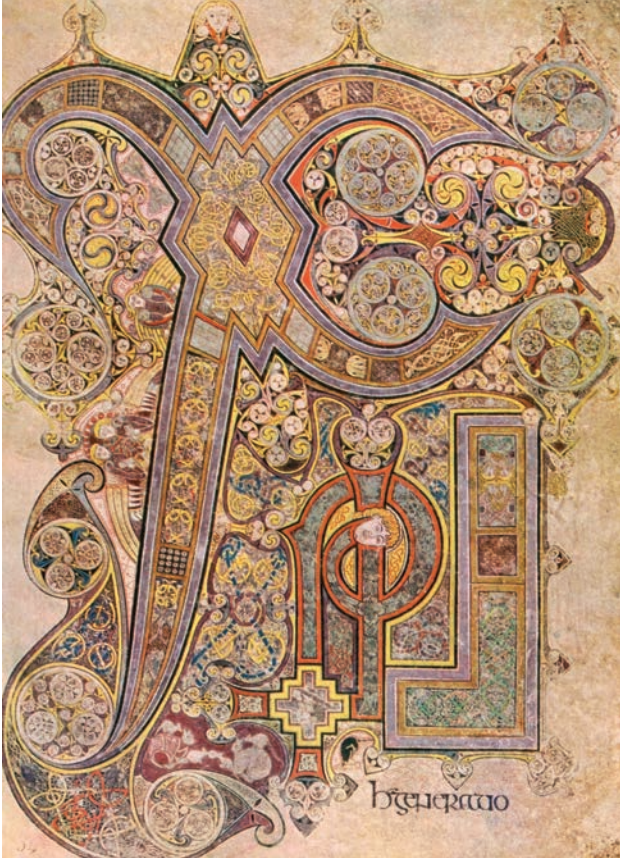
5 The Book of Kells , 9 ος αι., Δουβλίνο, Trinity College Library, Folio 34, recto: Χριστόγραμμα

οι γνώσεις μας για τη γλυπτική αυτών των χρόνων είναι πολύ περιορισμένες και αντλούνται κυρίως από ευάριθμα κιονόκρανα, θωράκια και επιτύμβιες στήλες. Το μάρμαρο δεν χρησιμοποιήθηκε σχεδόν ποθενά· μόνο κοινή τοπική πέτρα, λόγω του χαμηλού κόστους μεταφοράς, και στούκο, λόγω της ευκολότερης εφαρμογής του. Ένα από τα σημαντικότερα εικονογραφημένα χειρόγραφα της περιόδου, το οποίο έμμεσα επιτρέπει να υποθέσουμε ότι οι αργυροχρυσόχοι συνεργάζονταν με τους τεχνίτες του ελεφαντοστού, είναι το Ευαγγελιστάριο του Lorsch ή Codex aureus , προερχόμενο από τον St Nazarius στο Lorsch του γερμανικού κρατιδίου της Έσσης, δουλεμένο με χρυσό μελάνι πιθανότατα στο βασιλικό scriptorium του Aachen γύρω στο 810. Η στάχωσή του αποτελείται από ανάγλυφες παραστάσεις σε ελεφαντοστό, κατανεμημένες σε πέντε οριζόντια και κάθετα διάχωρα στο recto, και σε ισάριθμα στο verso. Στο μέσον της εμπρόσθιας όψης απεικονίζεται η Παναγία με το Βρέφος ένθρονη , πλαισιωμένη από δύο γενειοφόρους αγίους, ενώ επάνω, προτομή του Χριστού μέσα σε tondo ή clipeus, που ανακρατούν δύο άγγελοι και κάτω, η Γέννηση του Χριστού και ο Ευαγγελισμός των Ποιμένων . Αντίστοιχα, στην οπίσθια όψη και με όμοια διάταξη στο μέσον απεικονίζεται ο Χριστός όρθιος , πλαισιωμένος από τους δύο αρχαγγέλους, ένας σταυρός σε tondo, που ανακρατούν πάλι δύο άγγελοι επάνω, και στο κάτω μέρος η Προσκύνηση των Μάγων . Και