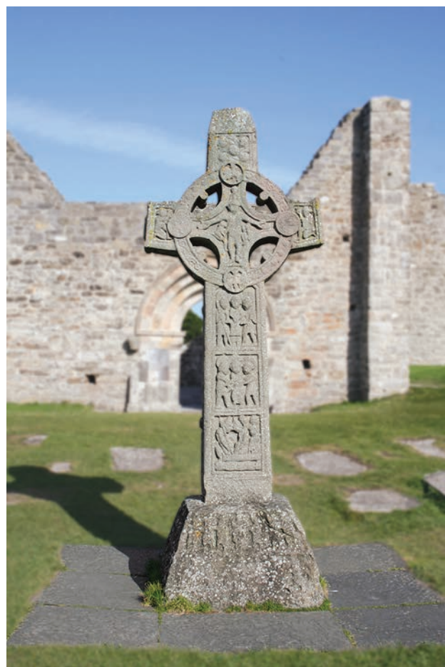
1 Ο Σταυρός των Γραφών, c.900, Clonmacnoise Monastery, Ιρλανδία

Οι έξι αιώνες που ακολούθησαν την κατάρρευση του ρωμαϊκού κράτους, η περίοδος δηλαδή που μαζί με τους επόμενους τρεις τουλάχιστον μοιάζει να συμπίπτει ανάμεσα στην Κλασική Αρχαιότητα και στην Αναγέννηση, ονομάστηκε Μεσαίωνας και –είτε από μονομερή έμφαση στα αρνητικά της χαρακτηριστικά είτε λόγω της σχετικής ένδειας δεδομένων– υποτιμήθηκε με το επίθετο «σκοτει-