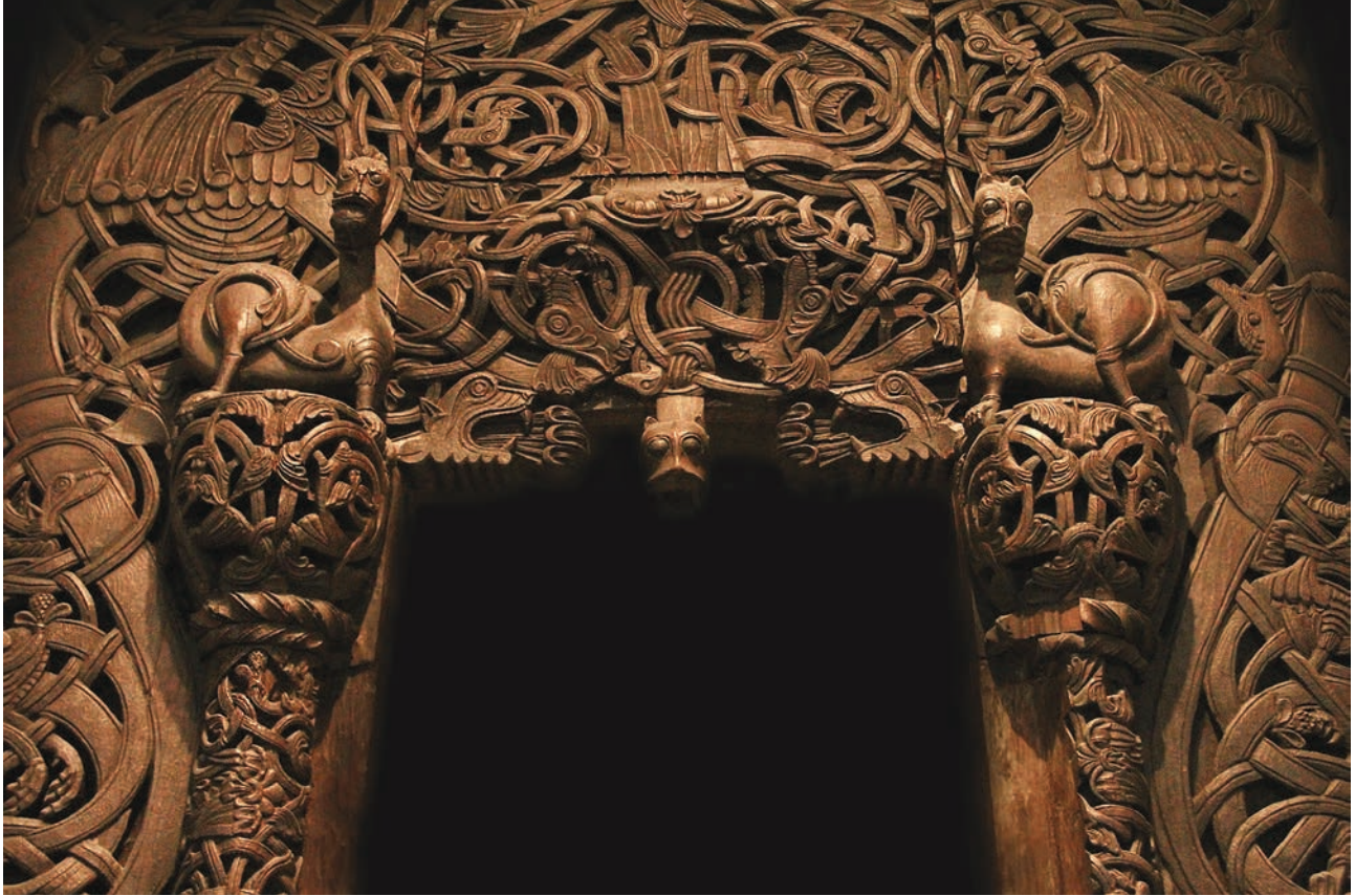
2 Ξυλόγλυπτη επένδυση θύρας (λεπτομέρεια), 12 ος αι., Όσλο Kulturhistorik Museum

νή» (Dark Ages). Οι ιστορικοί διακρίνουν στην πρώτη φάση της δύο υποπεριόδους με μεγάλη ρευστότητα στα χρονολογικά τους όρια: την Καρολίγγεια, από τα τέλη του 8 ου ως το πρώτο μισό του 10 ου αιώνα, και την Οθωνική, από τα μέσα του 10 ου ως το πρώτο μισό του 11 ου αιώνα. Αυτή η περιοδοποίηση, βασισμένη στα ονόματα των ιδρυτών δύο δυναστειών της Αγίας Ρωμαϊκής Αυτοκρατορίας, απλοποιεί βέβαια κάποια μεθοδολογικά ζητήματα, αλλά ταυτόχρονα παραθεωρεί άλλους, ίσως πολύ πιο κρίσιμους παράγοντες, όπως για παράδειγμα τον ρόλο των μη γαλαζοαίματων, παπών, επισκόπων και ηγουμένων, στην καθίδρυση μοναστηριών και ναών, στη διαμόρφωση των εικονογραφικών προγραμμάτων και γενικότερα του διακόσμου τους, στην επιλογή τεχνιτών καθώς και στην παραγγελία φορητών τεχνουργημάτων.