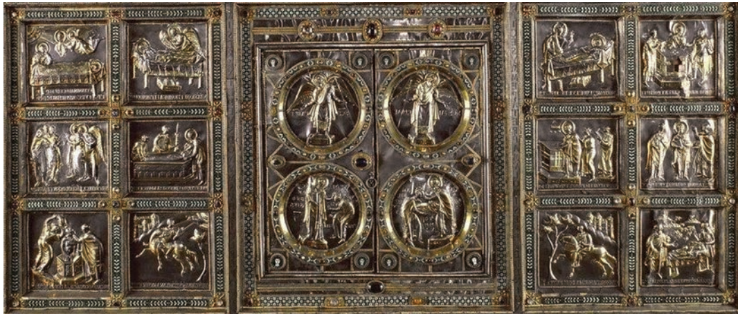
7 Paliotto Vuolvinus (τμήμα), c. 835, Βασιλική Αγίου Αμβροσίου, Μιλάνο

στις δύο όψεις υπάρχει μια αρκετά εμφανής σύγκλιση των πλευρών που εφάπτονται οριζοντίως, έτσι ώστε να δημιουργείται η ψευδαίσθηση της τρίτης διάστασης και το κεντρικό θέμα να θυμίζει ανοικτό τρίπτυχο. Εντύπωση προκαλεί το γεγονός ότι, αν και ο κώδικας περιλαμβάνει περικοπές του Ευαγγελίου, παρά τη συνήθη πρακτική στις σταχώσεις ευαγγελισταρίων, το recto όχι μόνο αφιερώνεται αντί του Χριστού στην Παναγία αλλά φαίνεται και περισσότερο επιμελημένο από το verso. Το σύνολο παραπέμπει τόσο στα υπατικά δίπτυχα της ρωμαϊκής περιόδου, όσο και σε ιουστινιάνεια πρότυπα, ενώ ο πανηγυρικός, δοξαστικός τόνος μετριάζεται από την ανεπαίσθητη ψυχρότητα και ακαμψία των μορφών.