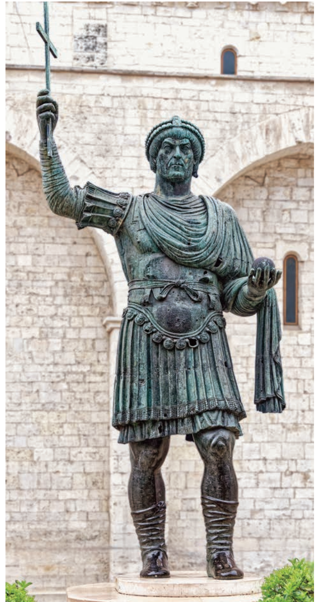
3 Ο Κολοσσός της Barletta, 4 ος -6 ος αι., Basilica del Santo Sepolcro, Barletta, N. Ιταλία

κών φύλων. Με επίσημη γλώσσα της Εκκλησίας τη Λατινική, τα μοναστήρια έγιναν εστίες παιδείας, κοινωνικής γαλήνης, μεγάλων παραγγελιών και παραγωγής βιβλίων (scriptoria) γύρω από την επιστήμη, την τέχνη και τη λογοτεχνία. Μέσα σε αυτό το πλαίσιο κατέστη δυνατή αργότερα η γέννηση και η άνθηση της ρομανικής αρχιτεκτονικής και γλυπτικής. Ορθά ο Richard Krautheimer χαρακτήρισε τον Γρηγόριο ως τον τελευταίο πάπα της χριστιανικής Αρχαιότητας και τον πρώτο πάπα του Μεσαίωνα 6 .