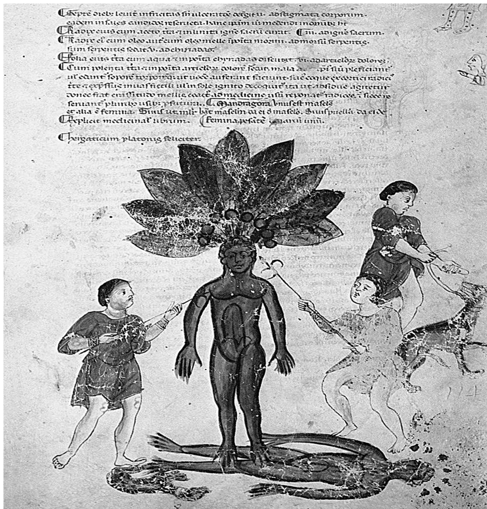
Εικόνα 2. Απεικόνιση των ιδιοτήτων του φυτού «μανδραγόρας» που χρησιμοποιούσαν ευρέως στην καθημερινή θεραπευτική για την αντιμετώπιση του πόνου ή ως αναισθητικό.

Στη δεύτερη φάση η θεραπευτική εξελίσσεται σε δαιμονιακή-ανιμιστική. Σε αυτή τη φάση υπάρχει ο γιατρός-μάγος, που γνωρίζει πώς να εξορκίζει το κακό και μπορεί να προβλέπει το μέλλον. Πρόκειται για το πιο έμπειρο μέλος της φυλής, που κατέχει τη θεραπευτική τέχνη, γνωρίζει τις ιδιότητες των φυτών καθώς και τα δηλητήρια των ζώων. Η γνώση αυτή φυλάσσονταν με απόλυτο μυστικό τρόπο. Το αίμα είχε έναν πρωτεύοντα ρόλο καθώς αποτελούσε το σύμβολο της ζωής και γιαυτό η μύηση γινόταν μέσα από επώδυνες και αιματηρές διαδικασίες. Ο πρωτόγονος μάγος, ιερέας και γιατρός χρησιμοποιεί ορισμένα μέτρα όπως για παράδειγμα βεντούζες ή απομύζηση για