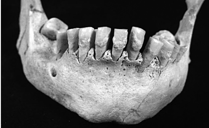
Εικόνα 4. Δόντια προϊστορικών γεωργών με τις αρχαιότερες άμεσες ενδείξεις κατανάλωσης γάλακτος στον κόσμο πριν περίπου 6.000 χρόνια.