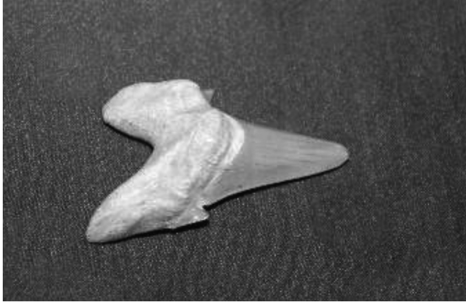
Εικόνα 3. Δόντι προϊστορικού καρχαρία.

προς τις τροπικές και τις πιο εύκρατες ζώνες της Ευρασίας. Έτσι, πριν από 600.000 χρόνια εμφανίζονται μεταβολές στις μορφές του Homo Erectus , ο οποίος εφοδιασμένος με τη χρήση της φωτιάς αποτόλμησε την εγκατάστασή του σε πιο ψυχρές περιοχές ακόμη και στις υποαρκτικές ζώνες προς τον Ειρηνικό ωκεανό. Ο πρακτικός νους του Homo Erectus άφησε ως πνευματική κληρονομιά στον άνθρωπο σημαντικές εφευρέσεις, όπως την αντίληψη περί συμμετρίας και την κατασκευή του πρώτου δίκροπου εργαλείου, τη χρήση της φωτιάς, την πρώτη οργάνωση ομαδικών κατασκηνώσεων, τη γέννηση των τοπικών παραδόσεων, τη χρήση των χρωματογόνων ουσιών και τις λειτουργικές συνήθειες, όπως την τεχνική της κοπής με κοπτικά εργαλεία [1, 3, 4, 12, 16].