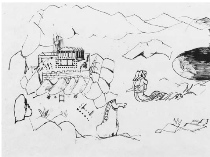
Εικόνα 7. Αττικά, μελάνι σε χαρτί