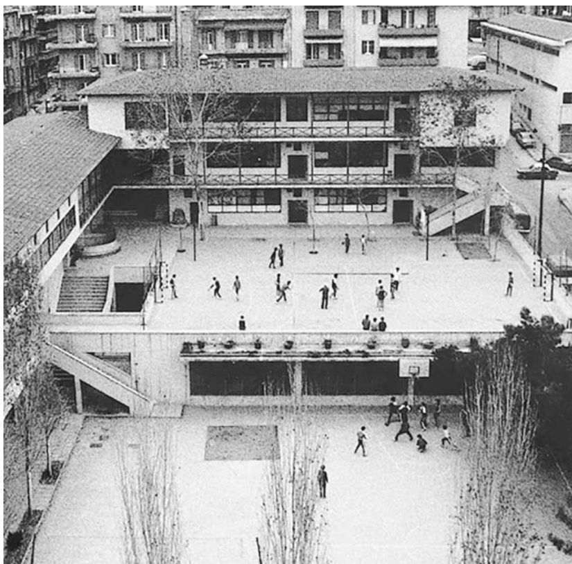
Εικόνα 6. Πειραματικό Σχολείο Θεσσαλονίκης