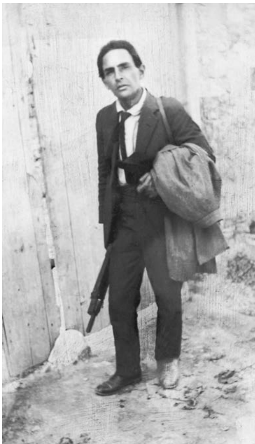
Εικόνα 5. Ο Δ. Πικιώνης στα χρόνια της ακμής του

Μερικές ακόμη δημιουργίες του απολύτως ενδεικτικά: Το Δασικό Χωριό στο Περτούλι (1953-1956), η διαμόρφωση του αρχαιολογικού χώρου γύρω από την Ακρόπολη και τον λόφο του Φιλοπάππου (1954-1958), μαζί με το εκκλησάκι και το αναπαυτήριο του Αγίου Δημητρίου του Λουμπαρδιάρη, διατηρητέο μνημείο αρχιτεκτονικής από την UNESCO, ο Παιδικός Κήπος της Φιλοθέης (1960-1964), που χαρακτηρίστηκε μνημείο της νεότερης Ελλάδας και πρότυπο παιδικού κήπου διεθνώς. Αντί άλλου σχολίου, θα δανειστώ μία φράση του Γ. Σεφέρη 6 για τα δημιουργήματα του Πικιώνη: ανήκουν στη “σειρά τών ἄξιων ἔργων τέχνης πού μέ τό πέρασμα τοῦ καιροῦ μᾶς φωτίζουν μ’ ἕνα φῶς ὄλο καί περισσότερο νέο, ὄλο καί περισσότερο σταθερό”.