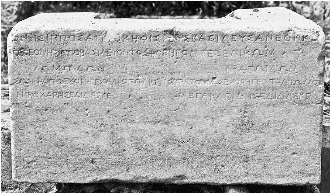
ΕΙΚΟΝΑ 3.1 Η αφιέρωση του βασιλιά Ονήσιππου (περ. 400 π.Χ.) (Ag I 7168· SEG 32. 239). Στην τρίτη σειρά (στα αριστερά) μπορεί να διαβάσει κανείς κωμωιδών και από κάτω το όνομα (Σωσικράτης) του μέτοικου νικητή χορηγού στον κωμικό διαγωνισμό των Αθηναίων. Ακολουθεί το όνομα του νικητή ποιητή Νικοχάρη. Φωτογραφία του Craig Mauzy, Αμερικανική Σχολή Κλασικών Σπουδών στην Αθήνα: Ανασκαφή στην Αγορά.

μέσω των λειτουργιών στα Λήναια, ίσως άρχισαν το 432 π.Χ., τουλάχιστον μια δεκαετία αφότου οι κωμωδίες εντάχθηκαν στο πλαίσιο των δραματικών αγώνων.