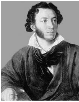
Алекса́ндр Серге́евич Пу́шкин