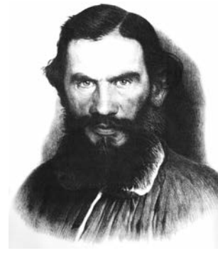
Лев Никола́евич Толсто́й