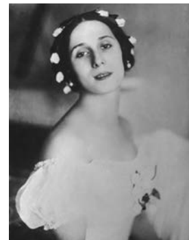
Анна Па́вловна Па́влова