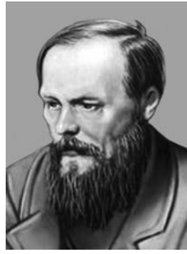
Фёдор Миха́йлович Досто́евский