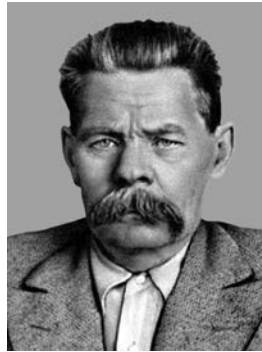
Макси́м Алексе́евич Го́рький