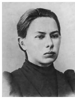
Наде́жда Константи́новна Крупская