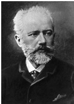
Пётр Ильи́ч Чайко́вский