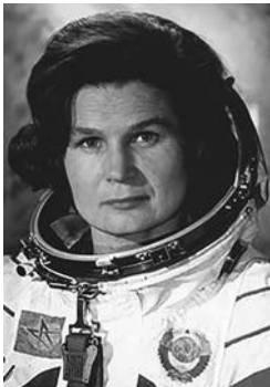
Валенти́на Влади́мировна Терешко́ва