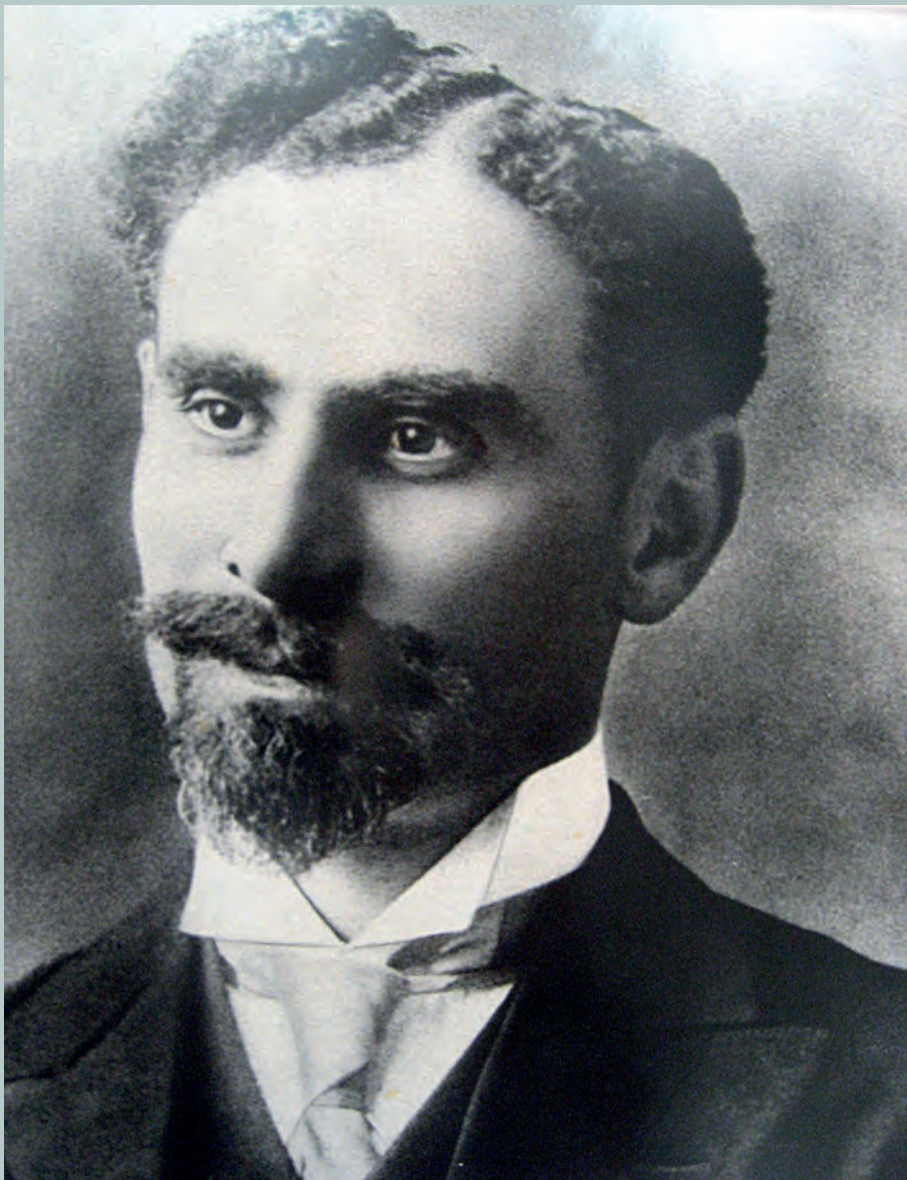
Ο Χριστόδουλος Σώζος, Δήμαρχος Λεμεσού, που σκοτώθηκε πολεμώντας στο Μπιζάνι, ως εθελοντής του ελληνικού στρατού, τον Δεκέμβριο του 1912. Το όνομά του δόθηκε στον πρώτο σύλλογο Κυπρίων της Θεσσαλονίκης, τον Δεκέμβριο του 1919.