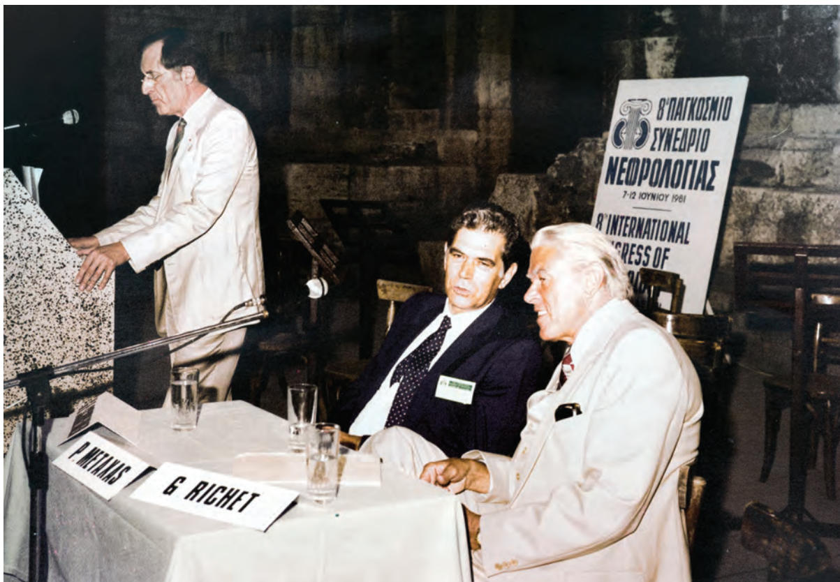
Ο Πάνος Μεταξάς, Πρόεδρος του 8ου Παγκόσμιου Συνεδρίου Νεφρολογίας, το 1981, στην Αθήνα.