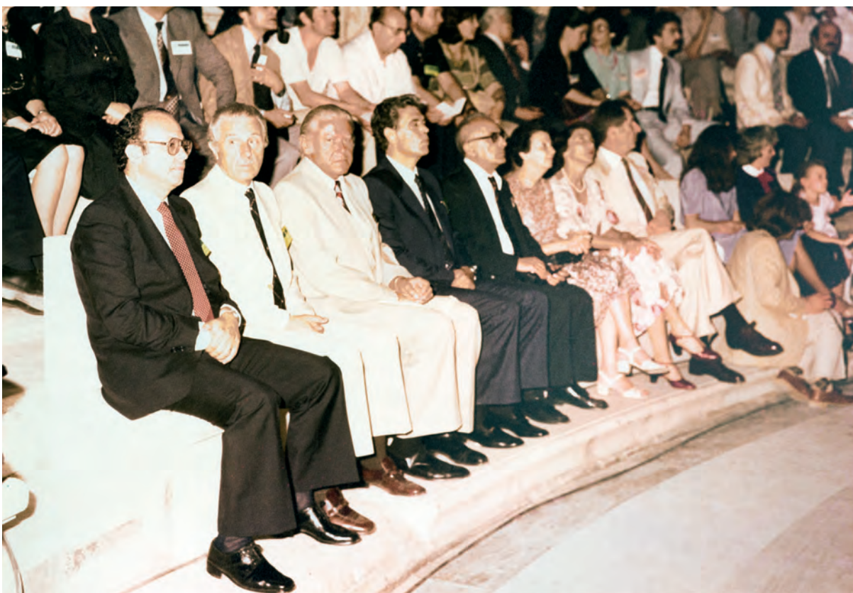
Ο Πάνος Μεταξάς στην τελετή έναρξης του 8ου Παγκόσμιου Συνεδρίου Νεφρολογίας, στο Ωδείο Ηρώδου του Αττικού.