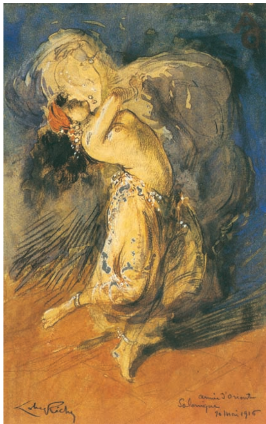
Lobel-Riche, Οδαλίσκη που χορεύει, 1916, υδατογραφία και μολύβι σε χαρτί.

Πάντως, εφημερίδες, περιοδικά και επιθεωρήσεις στις εμπόλεμες χώρες της Αντάντ σχολίαζαν την κοσμοπολίτικη ζωή αξιωματικών και στρατευμένων στη Θεσσαλονίκη. Πέρα από τα σχόλια για την κοσμοπολίτικη ζωή, η νικηφόρα συμμαχική επίθεση, με τη συμβολή και του ελληνικού στρατού, τον Σεπτέμβριο του 1918 στο Μακεδονικό Μέτωπο, δείχνει την πραγματική διάσταση του πολέμου 29 .