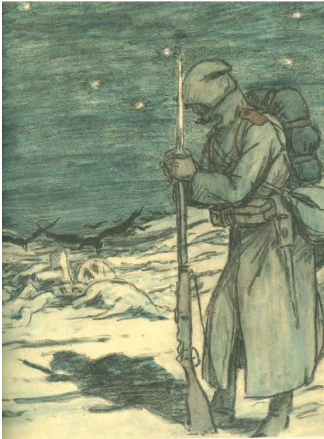
Ηλίας Κουμετάκης, προπαγανδιστική εικόνα για την έξοδο της Ελλάδος στον πόλεμο, 1916, κάρβουνο και κραγιόνια.

Όταν ανακαλούμε τον «Μεγάλο Πόλεμο», έτσι τον αποκαλούσαν οι άνθρωποι που τον έζησαν, στον νου μας έρχονται, μαζί με τα πολεμικά γεγονότα, τα ονόματα μιας μεγάλης γενιάς νέων ανθρώπων, ποιητών 26 , καλλιτεχνών, επιστημόνων, που χάθηκε στα χαρακώματα, αφήνοντας μαρτυρίες και τεκμήρια για τη φρίκη του πολέμου. Είναι γεγονός ότι η «ανυπόμονη γενεά» της Belle époque θα βαδίσει στην αρχή με ενθουσιασμό προς τα πεδία των μαχών, αλλά η πολεμική εμπειρία θα απέχει πολύ από τη νικηφόρο έκβαση και την ηρωική προσδοκία 27 .