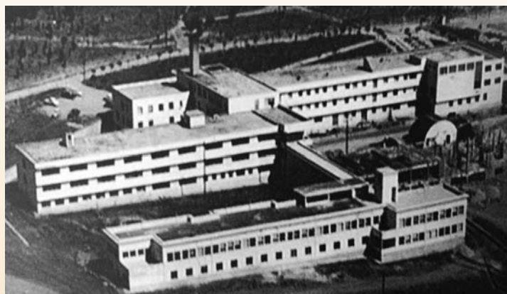
Το Πανεπιστημιακό Νοσοκομείο ΑΧΕΠΑ κατά την ίδρυση του (1953) | AHEPA University Hospital in 1953

At that time, Greece was under development. The AHEPA Hospital was built in Thessaloniki with a generous donation of the American Hellenic Educational and Progressive Association (AHEPA). In 1953 AHEPA Hospital was inaugurated and became "the scenery" of the Department referred in the present book.