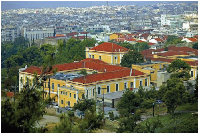
▲ Κεντρικό Νοσοκομείο Θεσσαλονίκης (αρχικά Νοσοκομείο Προσφύγων) "Kentrikon» Hospital of Thessaloniki