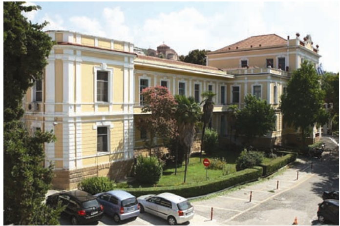
▲ Δημοτικό Νοσοκομείο Θεσσαλονίκης (νυν Άγιος Δημήτριος) Municipal Hospital of Thessaloniki