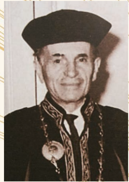
Καθηγητής Νικόλαος Καβαζαράκης ▶ Professor Nikolaos Kavazarakis

Σημειώνεται ότι με την ίδρυσή της από τον Καθηγητή Μαρίνο Σιγάλα το 1943, η Β' Χειρουργική Κλινική του Αριστοτελείου Πανεπιστημίου Θεσσαλονίκης αρχικά εγκαταστάθηκε στο Κεντρικό Νοσοκομείο, μετακόμισε στο Δημοτικό Νοσοκομείο το 1947 με Καθηγητή τον Νικόλαο Καβαζαράκη, μετεγκαταστάθηκε το 1952 στο Νοσοκομείο ΑΧΕΠΑ και επανήλθε στο Κεντρικό Νοσοκομείο το 1965, όπου και παρέμεινε οριστικά. Στην κλινική αυτή ιδρύθηκε Καρδιοχειρουργικό Εργαστήριο το 1959 και το 1960 Εξωτερικό Ιατρείο για νοσήματα καρδιάς και αγγείων, με υπεύθυνο Καρδιολόγο τον Π. Βασιλικό.