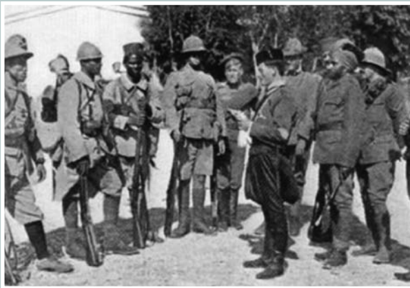
Εικ. 2. Από αριστερά προς τα δεξιά: ένας στρατιώτης από την Ινδοκίνα, ένας Γάλλος, ένας στρατιώτης από τη Σενεγάλη, ένας Βρετανός, ένας Ρώσος, ένας Ιταλός, ένας Σέρβος, ένας Έλληνας και ένας Ινδός.