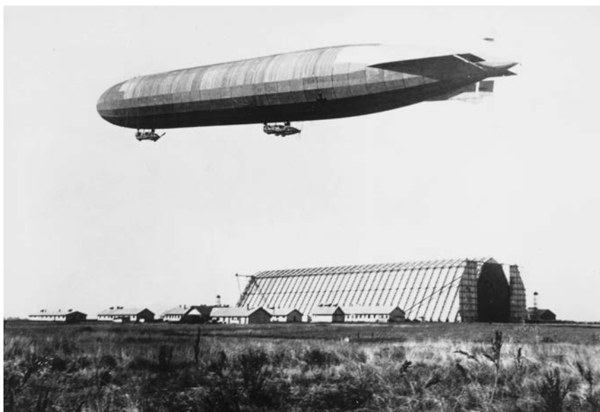
Το LZ-85 υπερίπταται της βάσης του στο Temesvar.