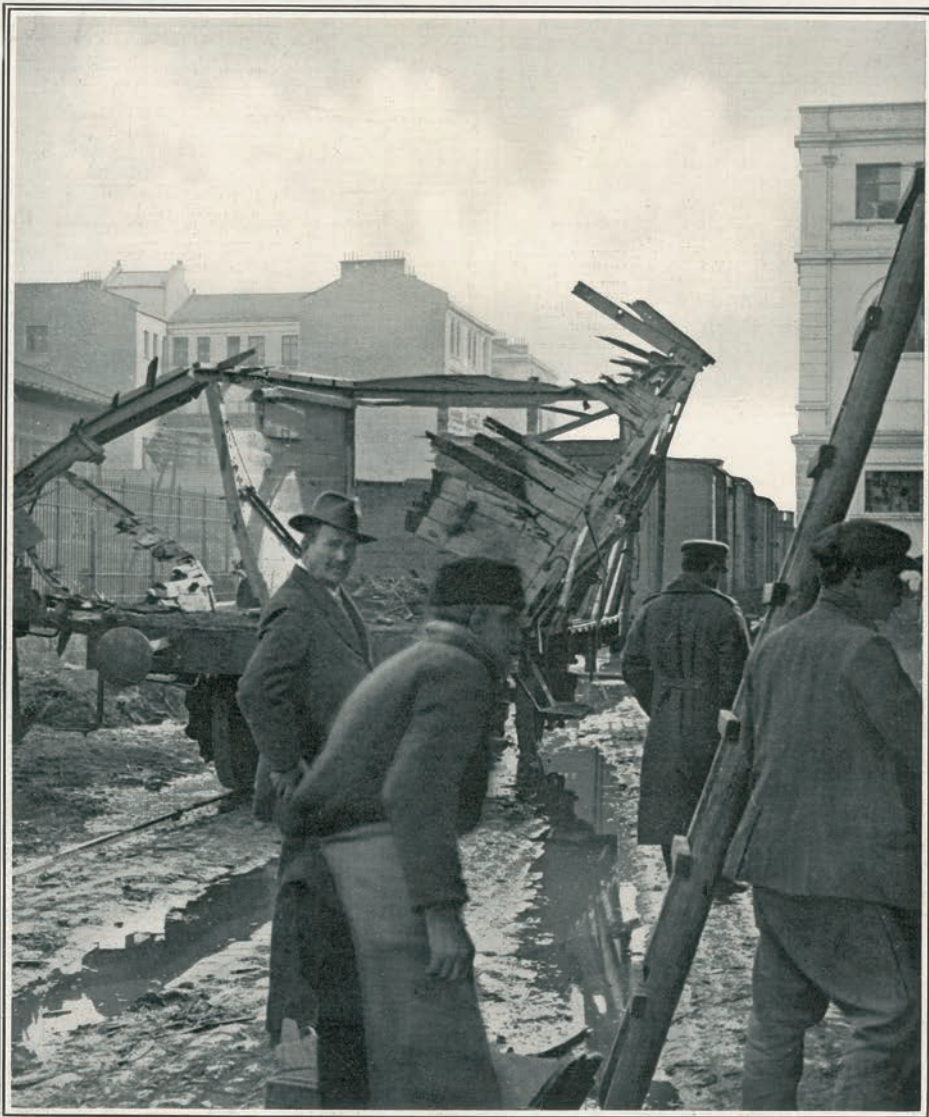
THE ZEPPELIN RAID ON SALONIKA: OUTSIDE THE BANQUE DE SALONIQUE