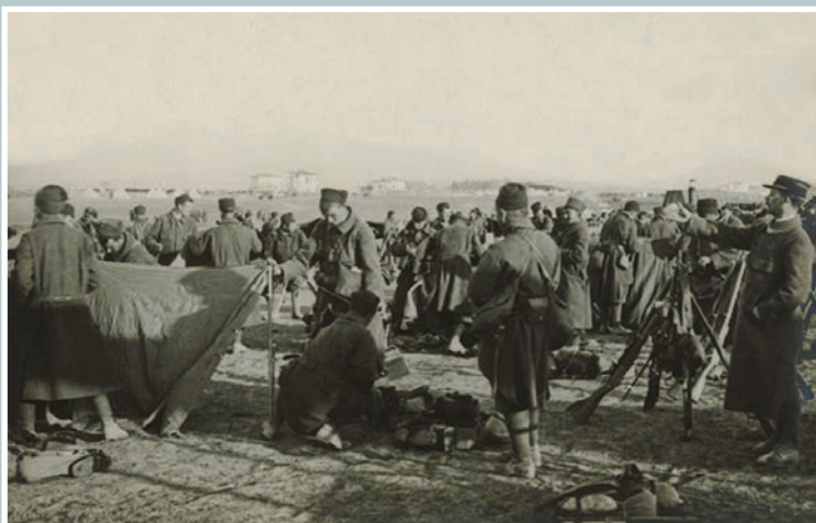
Το προσωρινό τους στρατόπεδο στη Μίκρα.