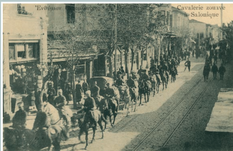
Οι Ζουάβοι παρελαύνουν κατά μήκος της Εγνατίας.