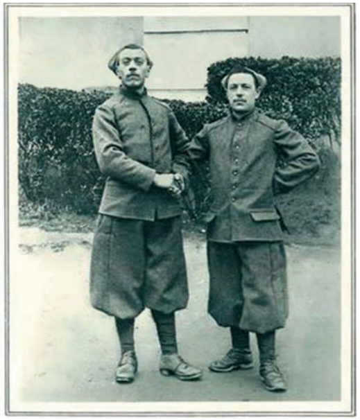
Οι καινούριες στολές – αριστερά των αξιωματικών και δεξιά των στρατιωτών.

SOUVENIR du 2 e Bis ZOUAVES EN - ORIENT - 1917.