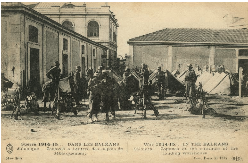
Guerre 1914-15... DANS LES BALKANS Salonique Zouaves à l'entrée des dépôts de débarquement