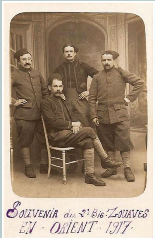
Τέσσερις Ζουάβοι ποζάρουν σε φωτογραφείο.

SOUVENIR du 2 e Bis ZOUAVES EN - ORIENT - 1917.