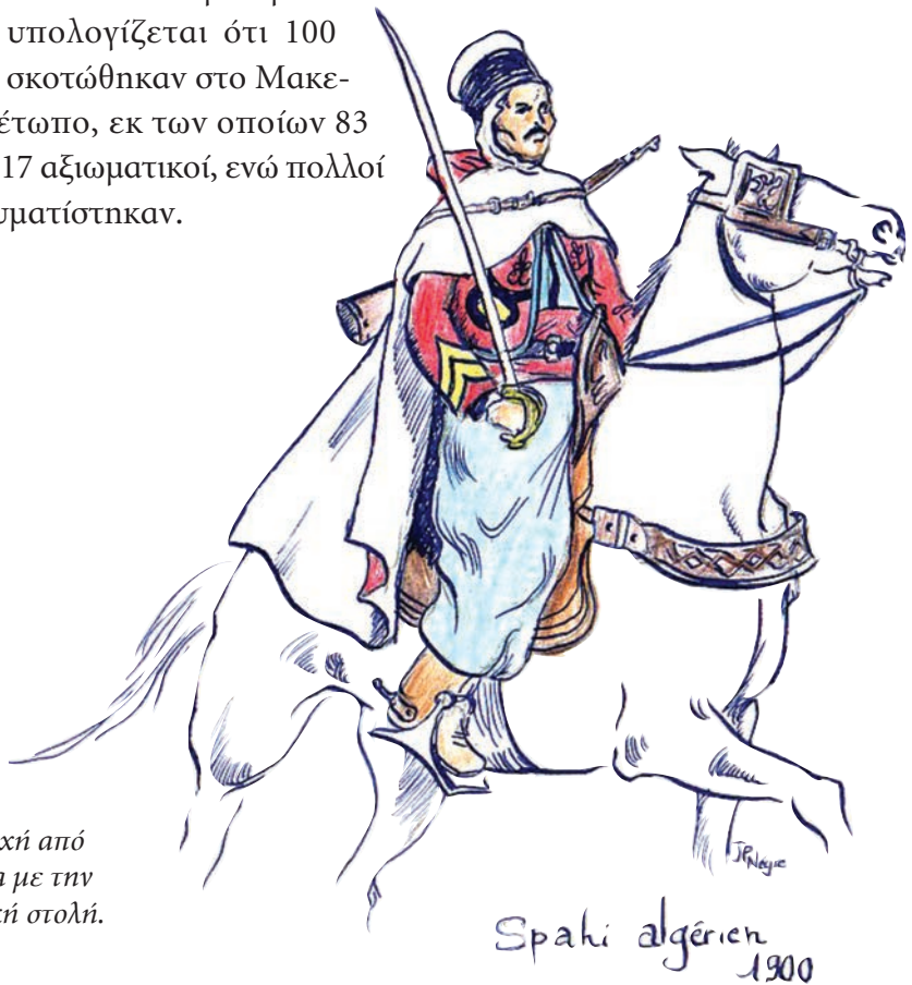
Σκίτσο Σπαχή από την Αλγερία με την παραδοσιακή στολή.

Στη διάρκεια του Α΄ Παγκοσμίου Πολέμου υπολογίζεται ότι 100 Σπαχίδες σκοτώθηκαν στο Μακεδονικό Μέτωπο, εκ των οποίων 83 ιππείς και 17 αξιωματικοί, ενώ πολλοί άλλοι τραυματίστηκαν.