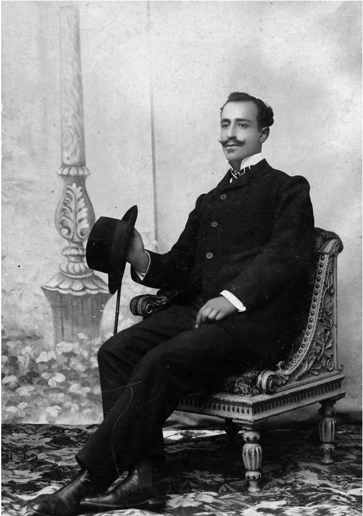
Αστική φορεσιά ανδρός, 1903.