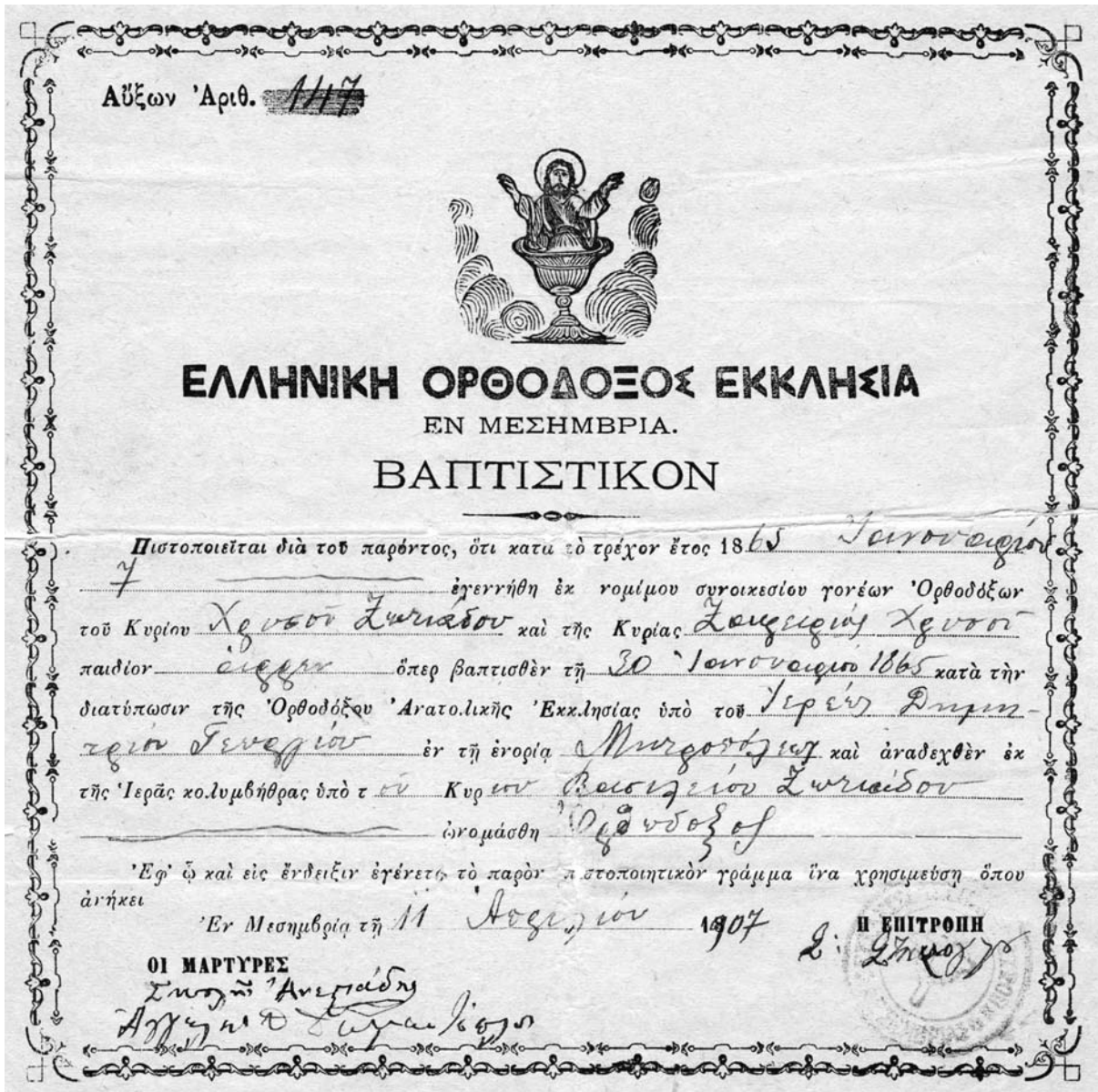
Βαπτιστικό του 1907.