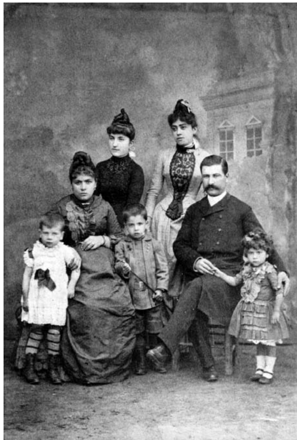
Οικογενειακή φωτογραφία του 1910.