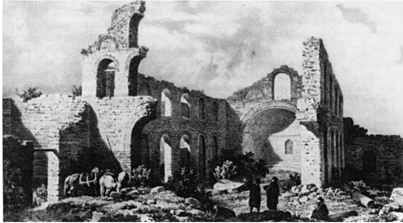
Τα ερείπια της πρώτης μητρόπολης της αγίας Σοφίας το 1877.