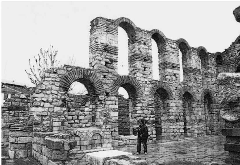
Τα ερείπια σήμερα.