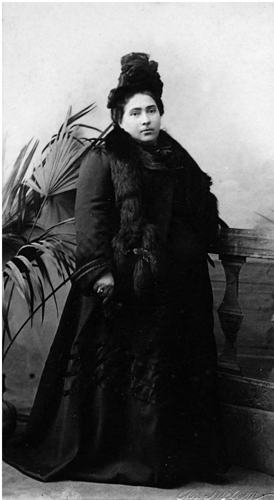
Φωτογραφία του 1903 με ρούχα εποχής.