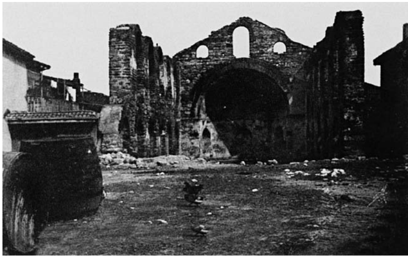
Τα ερείπια της παλαιάς μητρόπολης της αγίας Σοφίας το 1900.