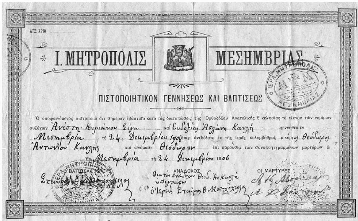
Πιστοποιητικό γεννήσεως και βάπτισης, 24 Δεκεμβρίου 1906.