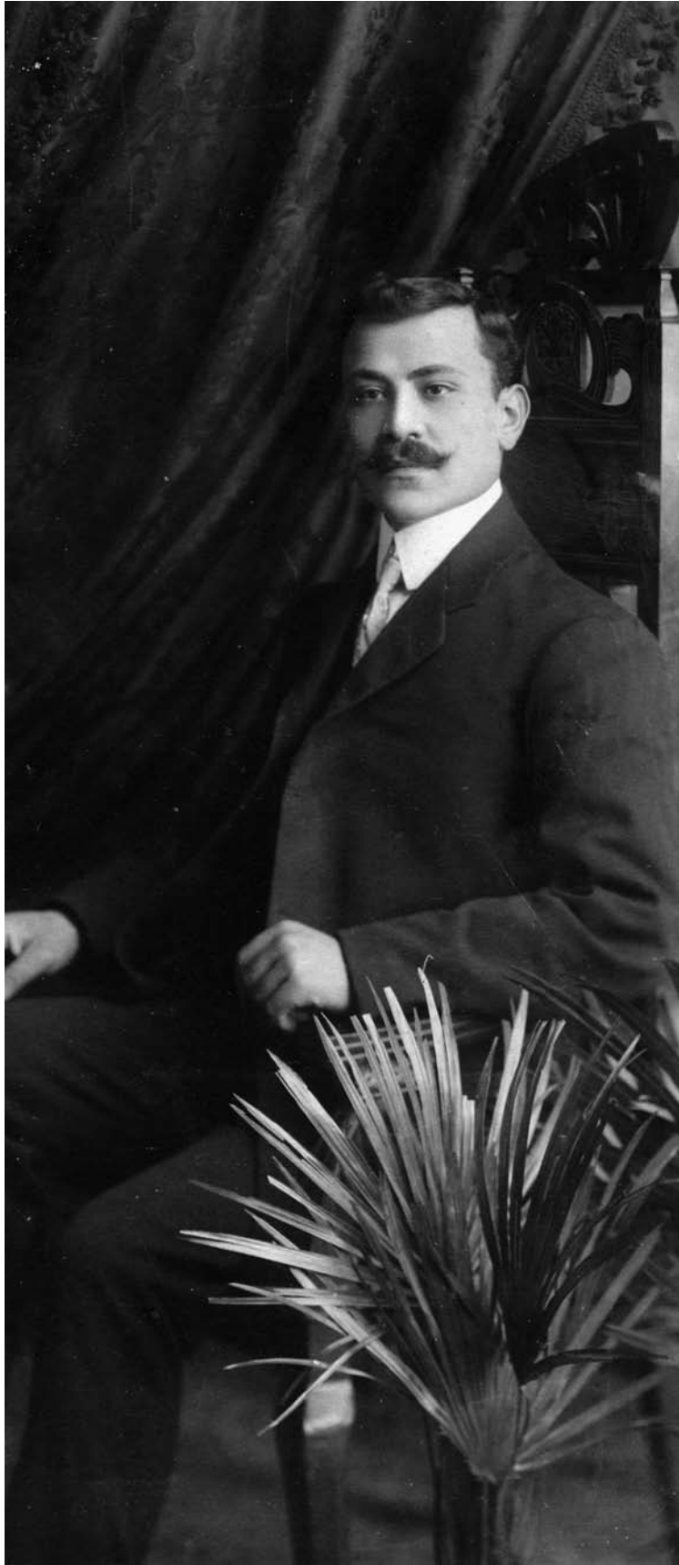
Χαρακτηριστική φωτογραφία ανδρός το 1901.