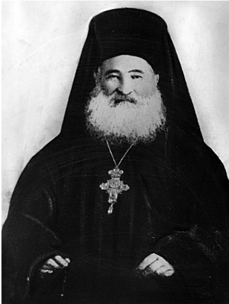
Ο μητροπολίτης Μεσημβρίας Χαρίτων το 1901.