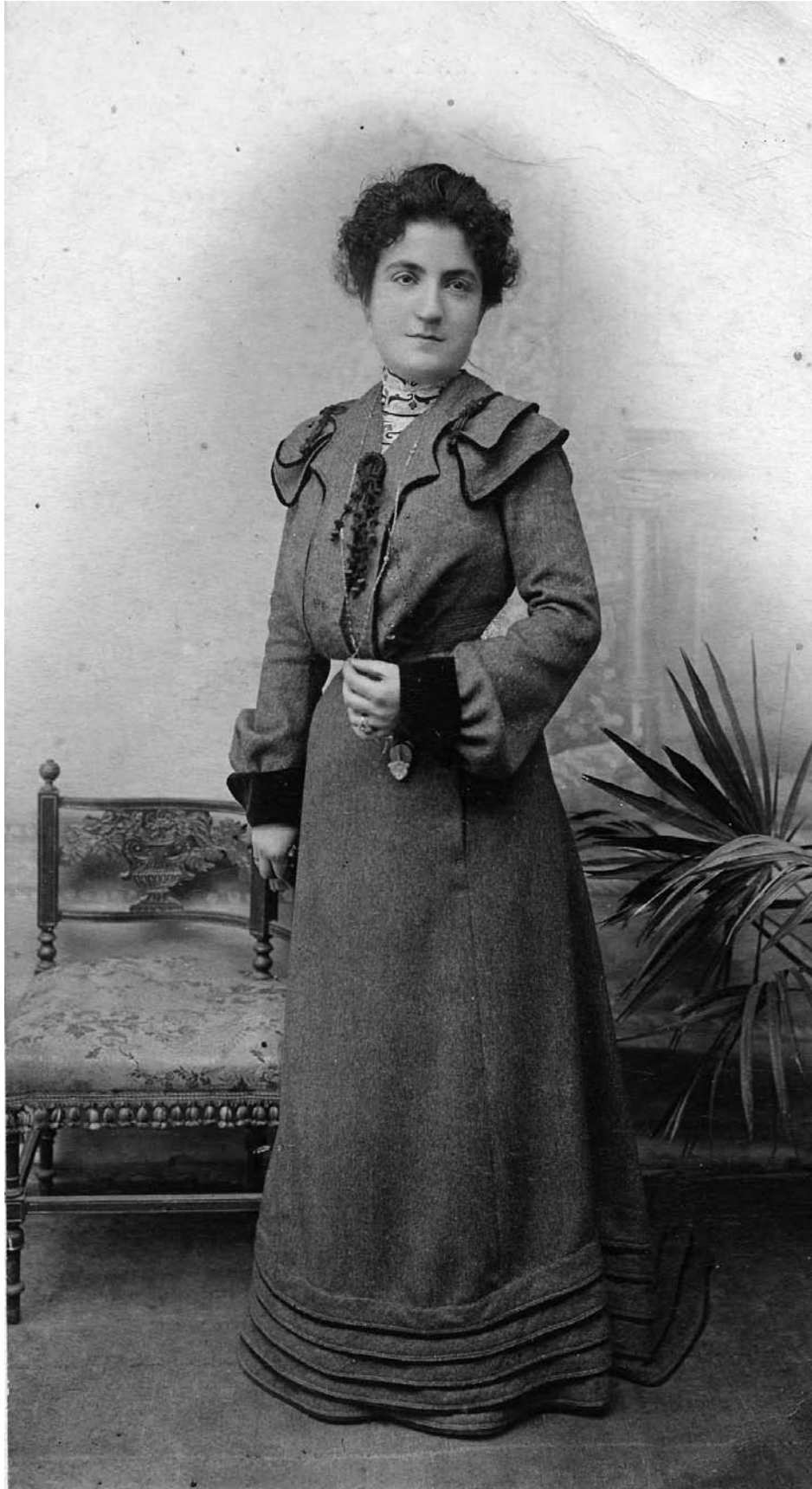
Νέα της εποχής με αστική ενδυμασία το 1903.