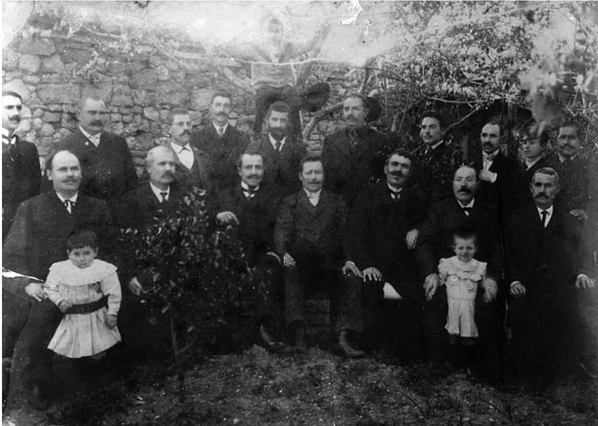
Το συμβούλιο του δήμου της Μεσημβρίας το 1906.