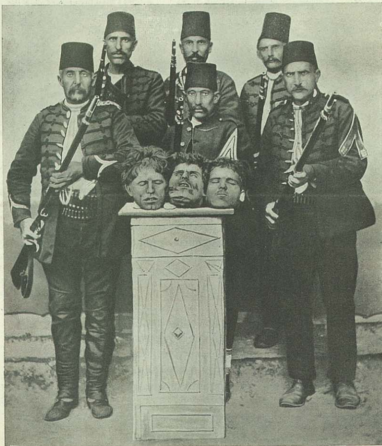
GRUPE DE SOLDATS TURCS POSANT, CHEZ LE PHOTOGRAPHE, AVEC LES TÊTES DE LEURS VICTIMES

LES ATROCITÉS TURQUES EN MACÉDOINE — DEVANT L'OBJECTIF