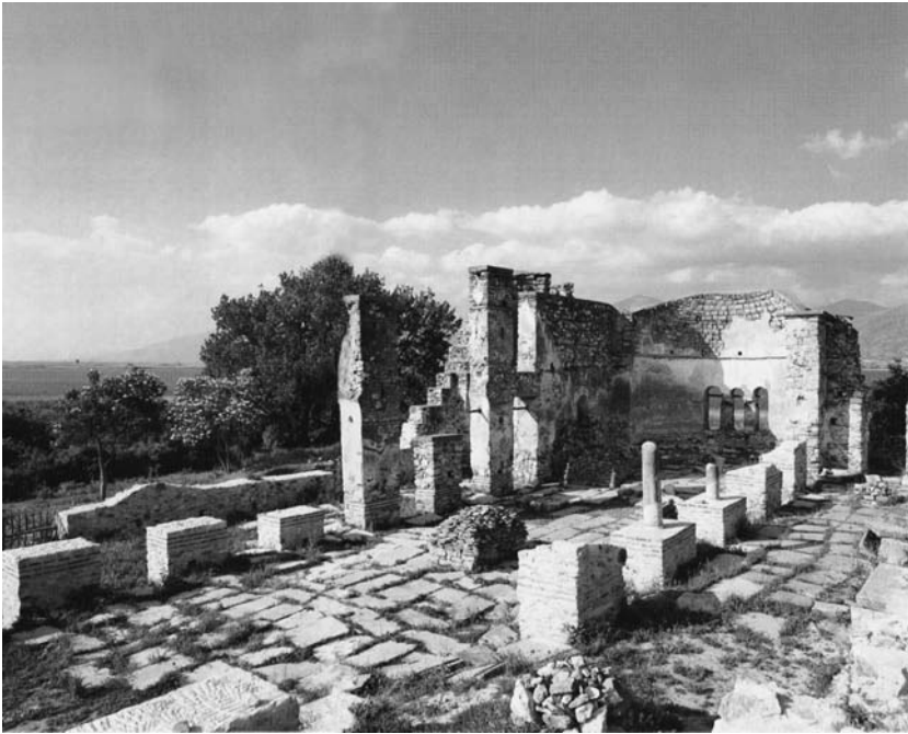
Η βασιλική του Αγίου Αχιλλείου στο ομώνυμο νησί στη Μικρή Πρέσπα.

ξάρτητο κράτος πρέπει να διαθέτει τη δική του Εκκλησία, οπότε και επεδίωξε εκκλησιαστική αυτονομία 24 .