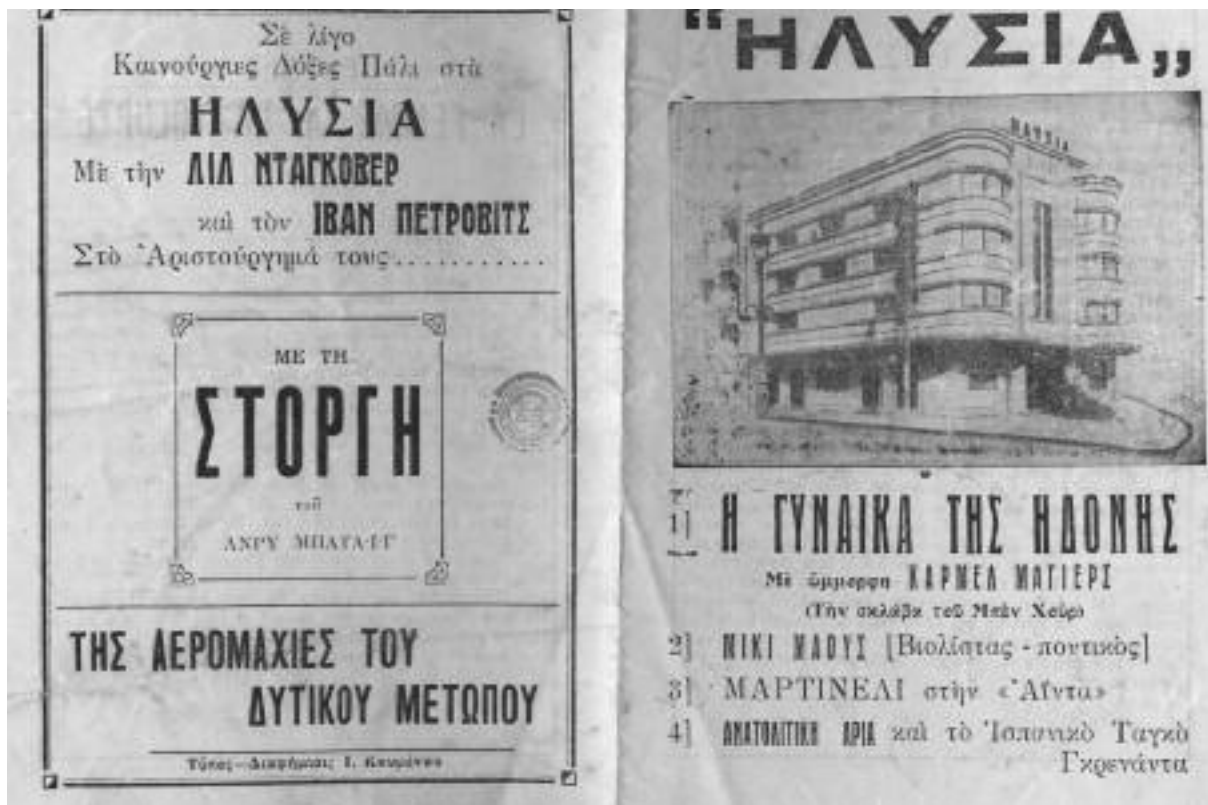
Μεσοπολεμικό διαφημιστικό του κινηματογράφου Ηλύσια

χρόνια πήγε από 20.000 σε 53.500, με 70% περισσότερες ταινίες και εμφανέστατη πύκνωση του κοινού στις αίθουσες.