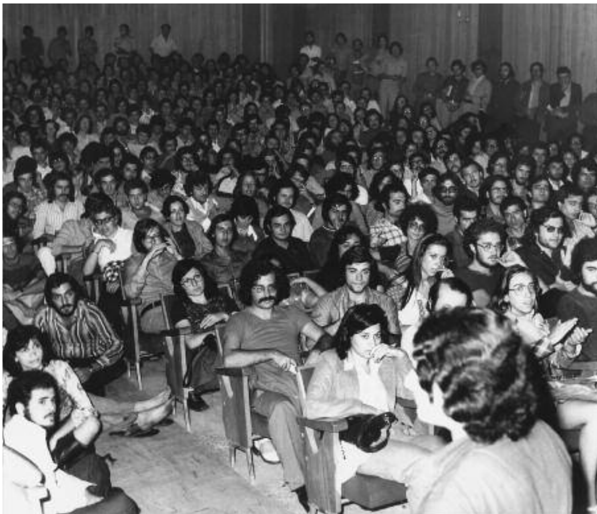
Στιγμιότυπο από το Φεστιβάλ Ελληνικού Κινηματογράφου Θεσσαλονίκης

μόνο στις οθόνες, σε 151 ταινίες από 53 χώρες, στα πηγαδάκια και στις συζητήσεις κοινού και κινηματογραφιστών. «Θέλω τον κόσμο να βγαίνει συνεπαρμένος από την κινηματογραφική εμπειρία και όχι από τα διαφημιστικά παιχνίδια που υποστηρίζουν άλλους στόχους. Ένα φεστιβάλ ανεξάρτητου κινηματογράφου, με πνεύμα οικονομίας αλλά χωρίς έκπτωση στις παραγωγές της παγκόσμιας κινηματογραφίας» 3 , λέει στην Καθημερινή ο Δημήτρης Εϊπίδης.