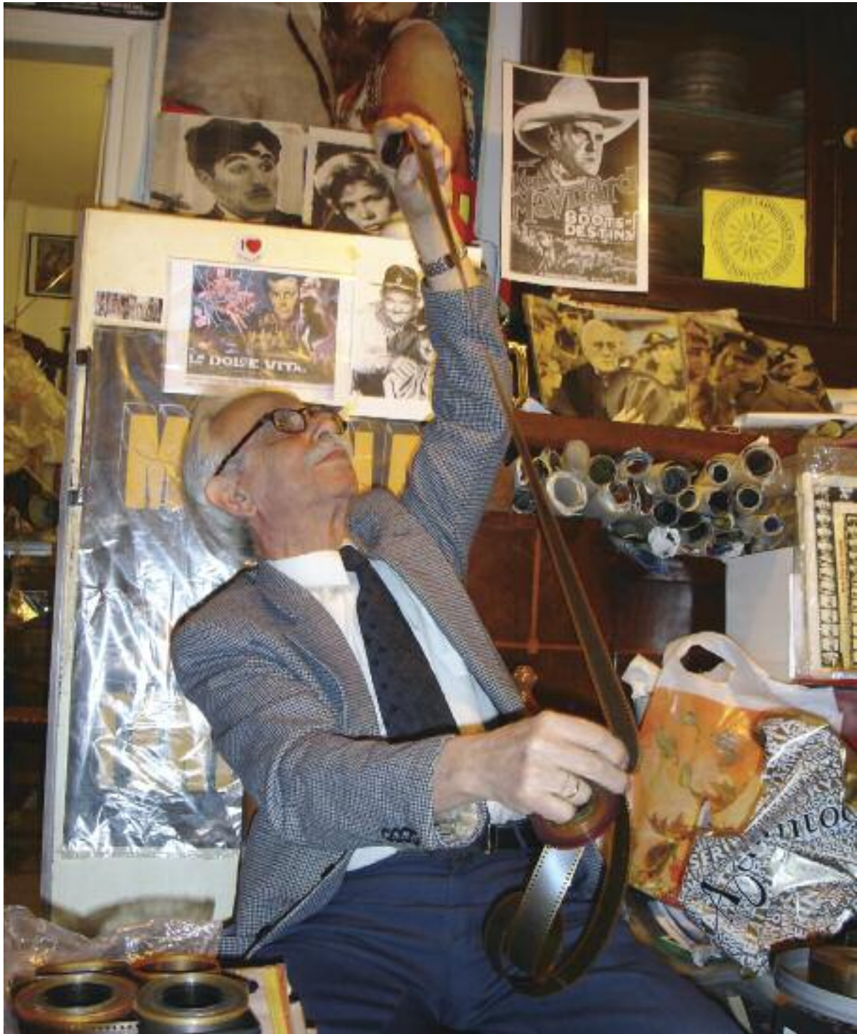
Ο κινηματογραφιστής και σκηνοθέτης Νίκος Μπιλιής στο εργαστήριό του