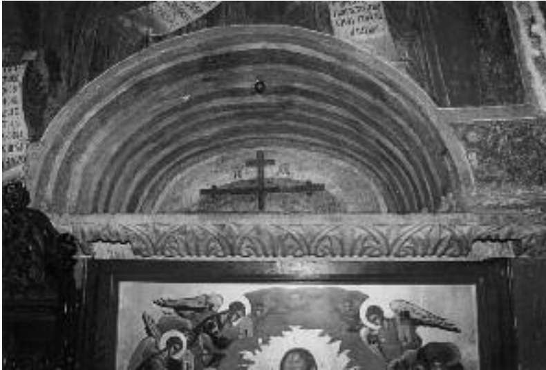
12. Η βορεινή είσοδος προς το σκευοφυλάκιο

του κενού ανάμεσα στον τοίχο του Καθολικού και στον προϋπάρχοντα (;) πύργο, φωτίζεται από στενή τυφεκιοθυρίδα. Στο πάτωμα από οπλισμένο σκυρόδεμα υπάρχει ένα άνοιγμα, από το οποίο μια μικρή σκάλα που βρίσκεται σε επαφή με τον καστρότοιχο οδηγεί στο αντίστοιχο υπόγειο του χώρου αυτού (A4).