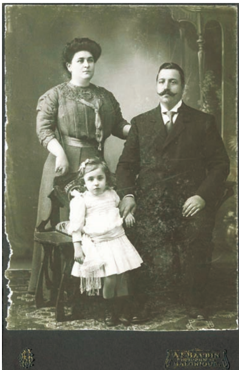
1.1 Μεσοαστική ελληνική οικογένεια.