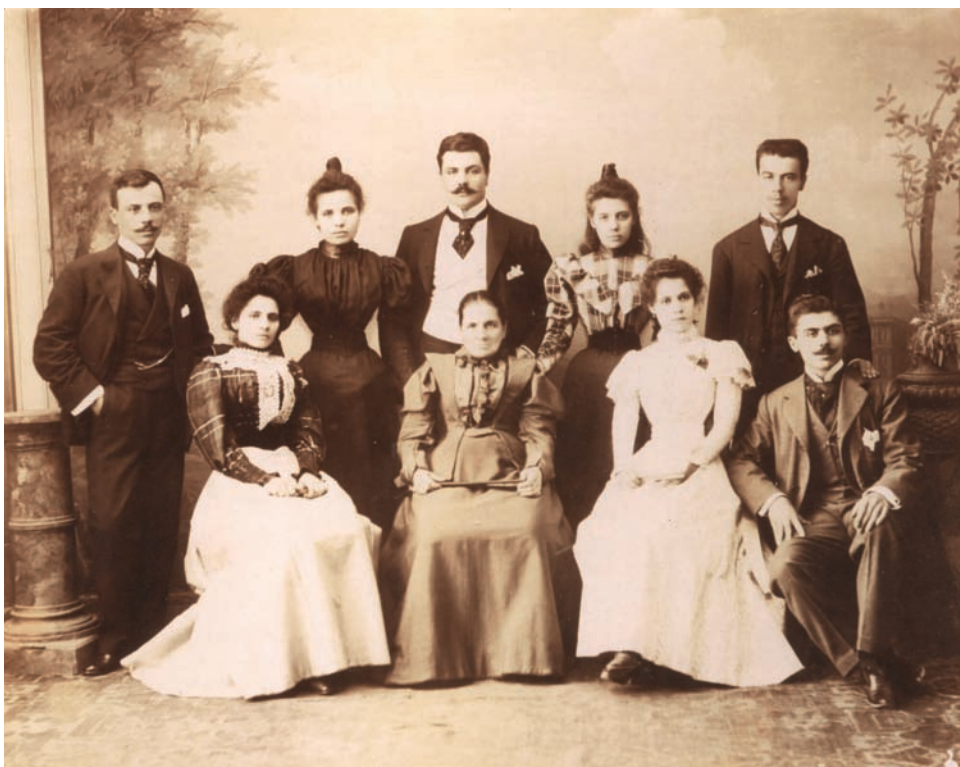
1.4 Μέλη της φραγκολεβαντικής οικογένειας των Άμποτ.