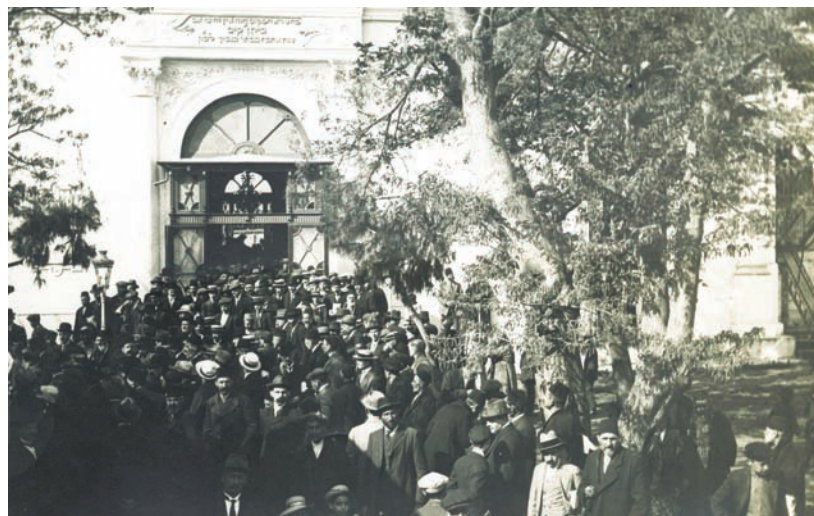
1.7 Πλήθος Εβραίων έξω από τη μεγάλη συναγωγή Talmud Torah.

Μετά τις εκλογές, μέσα σε όλη αυτήν την αναταραχή, ξέσπασε στην Αλβανία η πιο άγρια επανάσταση. Από τον Μάιο του 1912 η Αλβανία έβραζε. Στις 9/22 Ιουλίου 1912 οι Αλβανοί κατόρθωσαν να καταλάβουν την Πρίστινα, ενώ δέκα χιλιάδες αντάρτες μπήκαν στα Σκόπια και