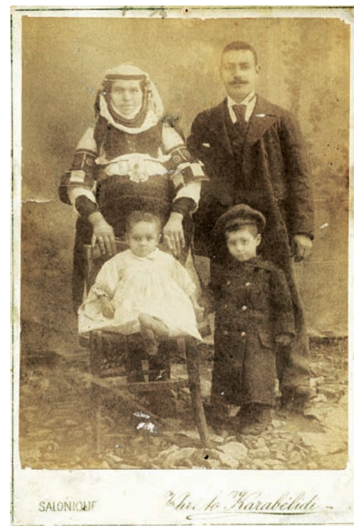
1.5 Μεσοαστική βουλγαρική οικογένεια.