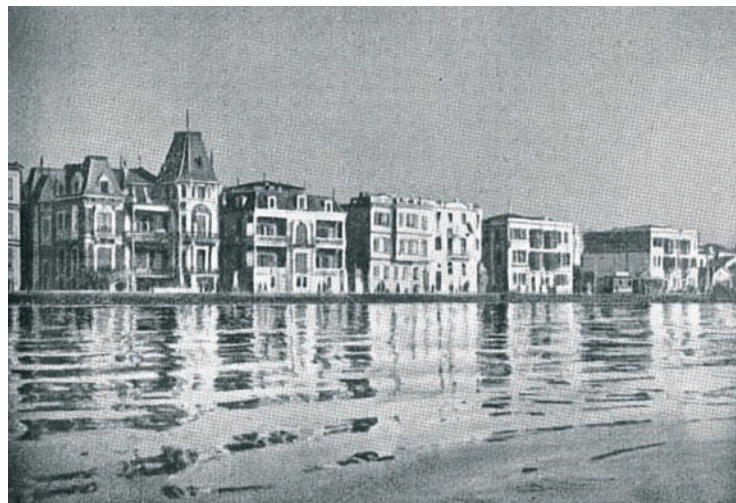
1.12 Όψη της παραλίας.

Οι ελληνικές εφημερίδες που κυκλοφορούσαν το 1912 ήταν η Μακεδονία του Κωνσταντίνου Βελλίδη, η Νέα Αλήθεια του Ιωάννη Κούσκουρα και από τις 15 Αυγούστου το Εμπρός του Σμυρναίου δημοσιογράφου Αντωνίου Οικονομίδη, μία αμφιλεγόμενη εφημερίδα που σύμφωνα με ορισμένους παράγοντες της ελληνικής κοινότητας χρηματοδοτούνταν από το Νεοτουρκικό Κομιτάτο. Όλες αυτές, όπως ήταν φυσικό, αντιμετώπιζαν σκληρή λογοκρισία. Το τελευταίο φύλλο της Μακεδονίας ήταν στις 5 Αυγούστου 1912 λόγω της καταδικαστικής απόφασης του τουρκικού στρατοδικείου που διέταξε την επ' αόριστον παύση της εξαιτίας της έντονης αρθρογραφίας και της εμμηρηστικής ειδησεο-