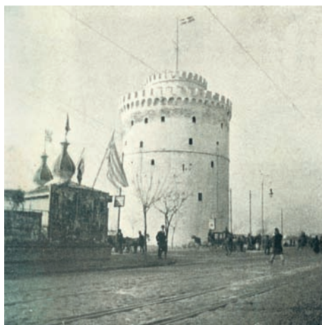
1.10 Ο Λευκός Πύργος.