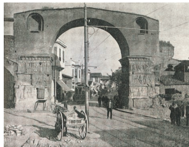
1.11 Η Καμάρα.

Η κοινωνική και καλλιτεχνική ζωή στη Θεσσαλονίκη όμως συνεχιζόταν. Η εβραϊκή κοινότητα έφερνε συχνά θιάσους και μουσικά συγκροτήματα από τη Γαλλία και την Αυστρία, ενώ πολύ συχνά διοργανώνονταν σουαρέ στις βίλες των πλουσίων στη λεωφόρο των Εξοχών. Η ελληνική κοινότητα δεν υστερούσε. Στις 28 Μαρτίου 1912 έφθασε στη Θεσσαλονίκη ο θιάσος της Μαρίκας Κοτοπούλη για σειρά παραστάσεων στο θέατρο του Λευκού Πύργου. Η Μακεδονία σε τέσσερα συνεχόμενα φύλλα της είχε πρωτοσέλιδη φωτογραφία της καλλιτέχνιδας. Στον θιάσο περιλαμβάνονταν οι αδελφές της Κοτοπούλη κυρίες Λούη και Μυράτ με τους συζύγους τους, η Αλκαίου, ο Παπαγεωργίου, ο Καντιώτης, ο Αργυρόπουλος και το ζεύγος Μαρίκου. Μεταξύ των έργων που παρουσίασε ήταν Ο Αντίπαλος του Alfred Capus, Η μικρή σοκολατιέρα του Paul Gavault, Ισραήλ του Henri Bernstein και Η κυρία του Μαξιμί του Georges Feydeau. Το καλοκαίρι ήρθε επίσης ο αθηναϊκός θιάσος του Ιωάννη Παπαϊωάννου (κωμικού ηθοποιού του μουσικού θεάτρου και του σημαντικότερου Έλληνα θιασάρχη της οπερέτας) και έδωσε πάνω από 20 παραστάσεις.