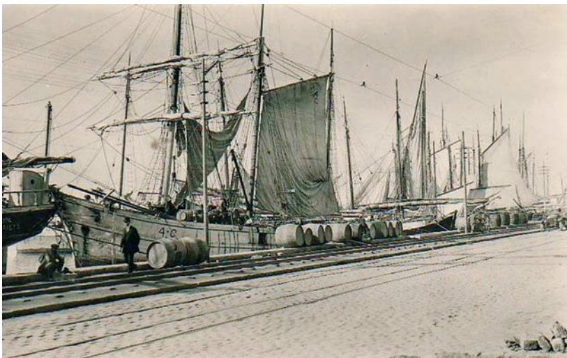
1.6 Η παραλία και το λιμάνι της Θεσσαλονίκης έσφυζαν από κίνηση.

φορολογική απαλλαγή, ετεροδικία κ.ά., ενώ συγχρόνως εξυπηρετούσαν τα κάθε είδους συμφέροντα, νόμιμα και μη, των προυχόντων της οθωμανικής άρχουσας τάξης.