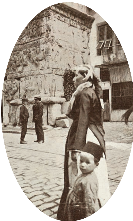
1.2 Εβραία με την παραδοσιακή ενδυμασία της και με το αγοράκι της στην Καμάρα.