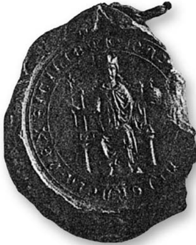
25. Σφραγίδα Μαμφρέδου (†MAYN[FRID]US DEI GRACIA REX SICILIE).

3. Littere clause . Φέρουν το όνομα του αποδέκτη, το χαιρετισμό salutem et dilectionem ή παρόμοια, ενώ κατά τα λοιπά μοιάζουν με τις littere patentes .