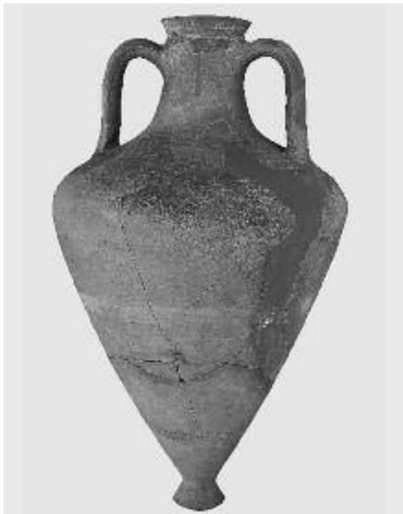
Εικ. 5. Οξυπύθμενος αμφορέας του Ευαγόρη επί Ηροφώντος. Πέλλα, Αγορά