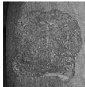
Εικ. 2. Σφράγισμα του αμφορέα της Εικ. 1

Το αγγείο φέρει μία σφραγίδα αποτυπωμένη στο ψηλότερο τμήμα, κοντά στην καμπύλη του ώμου της λαβής σύμφωνα με τον κανόνα αποτύπωσης των σφραγισμάτων στους αμφορείς της νεότερης γενιάς, στους οποίους υπήρχε ένα σφράγισμα στον ώμο της λαβής τους, αποτυπωμένο είτε στο ψηλότερο σημείο της λαβής, κοντά στο λαιμό, είτε στην περιοχή καμπύλωσης της λαβής για να συνδεθεί με το λαιμό, που είναι και η συνηθέστερη θέση τοποθέτησής τους 54 . Η κατάσταση διατήρησης είναι κακή και οφείλεται σε παραμόρφωση που επήλθε από σύρσιμο αντικειμένου στην επιφάνειά της. Η ενέργεια αυτή επέφερε καταστροφή του μεγαλύτερου μέρους της έξεργης επιφάνειας των γραμμάτων και του συμβόλου, έτσι ώστε η ανάγνωσή τους γίνεται δυνατή μόνο ύστερα από εξαντλητική ανάλυση των επιμέρους στοιχείων. Αν και οι τρεις γωνίες του ορθογώνιου σφραγίσματος έχουν παραμορφωθεί, διατηρούνται, όμως, αρκετά στοιχεία από την τέταρτη, το μέσο της μιας πλευράς και ανεπαίσθητο έξαρμα του κέντρου του επάνω ορίου του, ώστε να έχουμε με βεβαιότητα τις αποτυπωμένες διαστάσεις του, ύψος 0,028 και πλάτος 0,031 μ. 55 Το εθνικό Θ]ΑΣΙΩ]Ν →▲ με