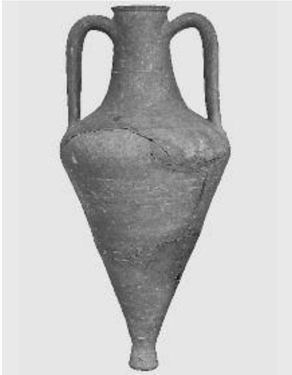
Εικ. 1. Οξυπύθμενος αμφορέας επί Μεγακλειίδα. Πέλλα, Αγορά