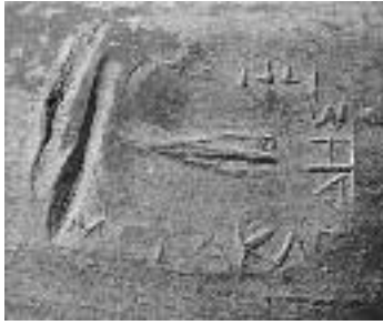
Εικ. 3. Σφράγισμα οξυπύθμενου αμφορέα. Πέλλα, Αγορά