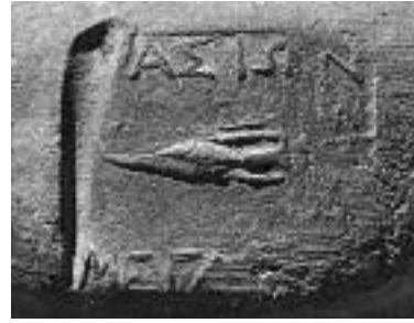
Εικ. 4. Σφράγισμα οξυπύθμενου αμφορέα. Πέλλα, Αγορά

την Πέλλα, αρ. ευρ. 83.230 (Εικ. 3) και 83.369 (Εικ. 4) 57 . Το σύνολο των εικονογραφικών λεπτομερειών των τριών αυτών σφραγισμάτων και οι διαστάσεις τους ταυτίζονται, έτσι ώστε μπορούμε με βεβαιότητα να υποστηρίξουμε την αποτύπωσή τους με την ίδια σφραγίδα 58 . Ακόμα, επισημαίνεται η μεγάλη ομοιότητα, ίσως και σχεδόν ταυτότητα του ύψους των τριών λαβών, της κλίσης τους, αλλά και της ταυτόσημης διατομής τους, που μας οδηγούν στο συμπέρασμα πως πρόκειται για τρία αγγεία του ίδιου πιθανότατα τύπου. Τέλος, πρέπει να σημειωθεί πως και τα τρία σφραγίσματα έχουν αποτυπωθεί κατά την αυτή φορά και με παρόμοια δύναμη πάνω στην μαλακή επιφάνεια του πηλού, όπως δείχνει το μεγαλύτερο βάθος προς την εξωτερική μεριά της λαβής, αλλά και ο τρόπος απομάκρυνσης της σφραγίδας από τη λαβή, έτσι ώστε στην αριστερή του άκρη το σφράγισμα να σχηματίζει χαρακτηριστική κοιλότητα. Τα στοιχεία αυτά δίνουν την εντύπωση πως και τα τρία αποτυπώθηκαν από το ίδιο χέρι, που μπορεί να ταυτίζεται και με τον δημιουργό των αγγείων. Δύο ακόμα τεχνικές λεπτομέρειες των λαβών βοηθούν ουσιαστικά προς αυτήν την κατεύθυνση. Η πρώτη σχετίζεται στη διαμόρφωση της εσωτερικής πλευράς των λαβών, κατά μήκος των οποίων σύρονται κάθετα, αλλά αποχωρισμένα τα δύο δάχτυλα, από τα οποία ο δείκτης πιέζεται περισσότερο. Η δεύτερη σχετίζεται με τον τρόπο εξομάλυνσης της εσωτερικής πλευράς των λαβών