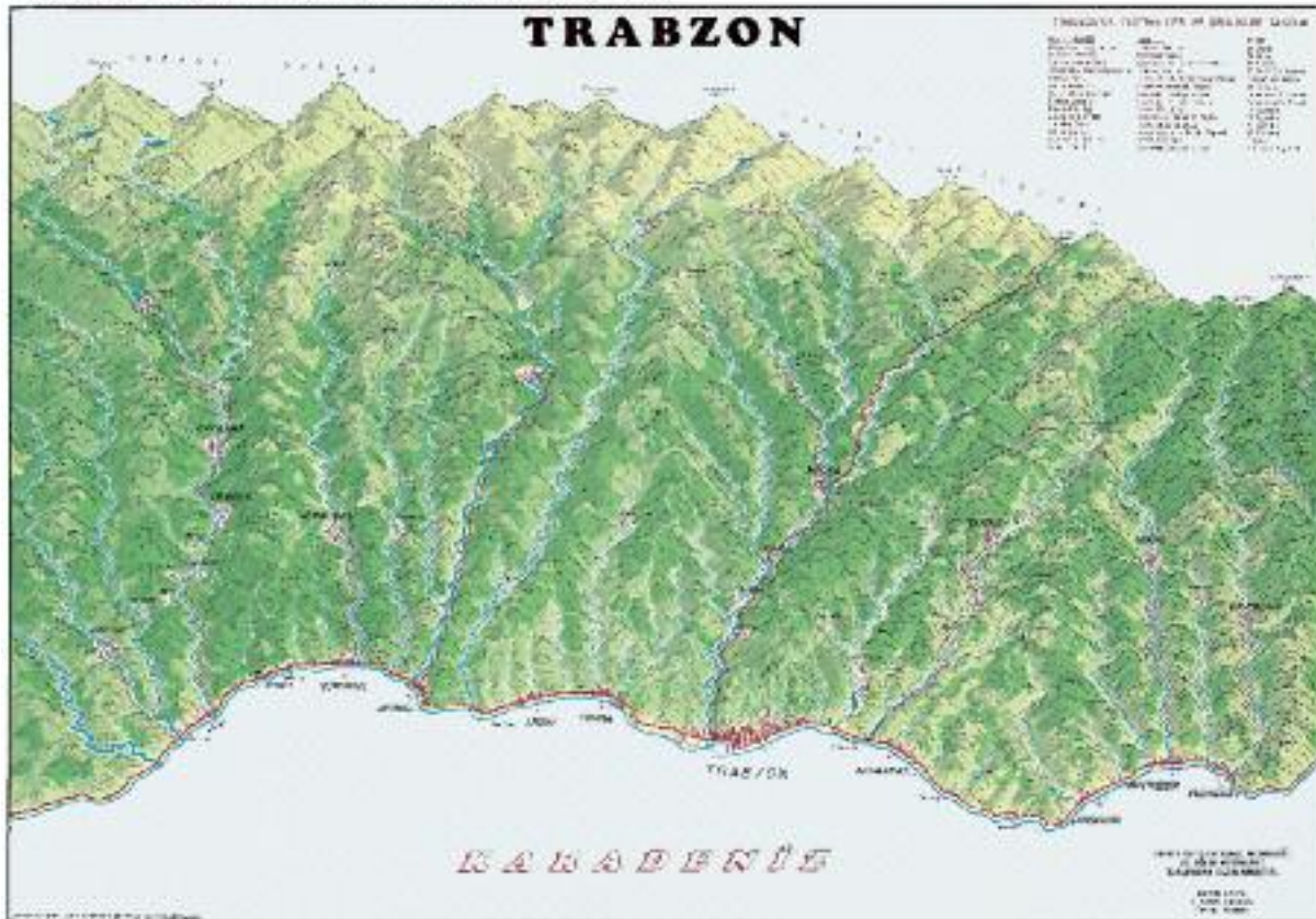
Χάρτης 3 Περιοχή Τραπεζούντας. Ανάγλυφο ορέων και χειμάρρων

Ο χάρτης 3 δίνει ιδιαίτερα παραστατικά την ευρύτερη περιοχή της Τραπεζούντας με το πλήθος των χειμάρρων που, διαβρώνοντας βίαια τον ορεινό όγκο, διαμορφώνουν την πολύ χαρακτηριστική μορφολογία της περιοχής. Θεωρείται ότι στις ακτές του Πόντου εκβάλλουν 107 χείμαρροι (βέβαια θα πρέπει να σημειωθεί ότι πολλοί έχουν στερέψει λόγω της οικιστικής εξέλιξης).