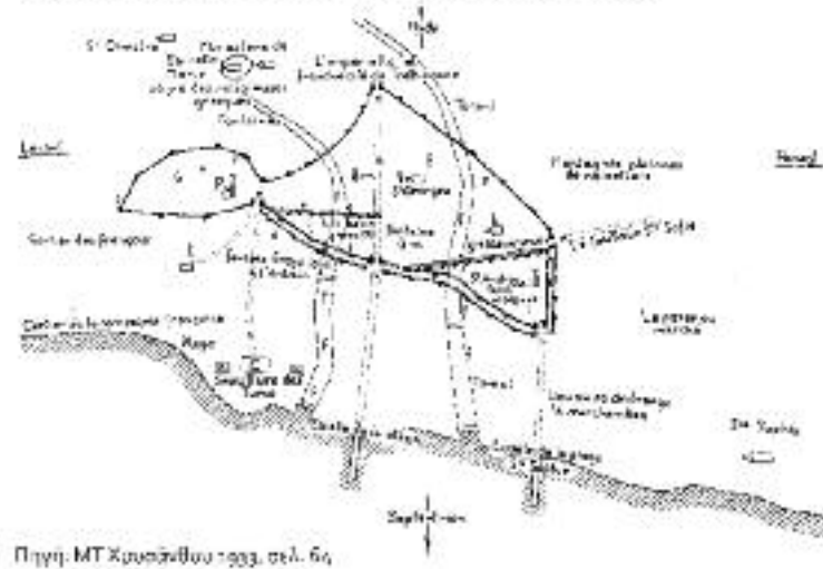
Χάρτης 4 Τραπεζούς, τοπογραφικός χάρτης του Bordier έτους 1609