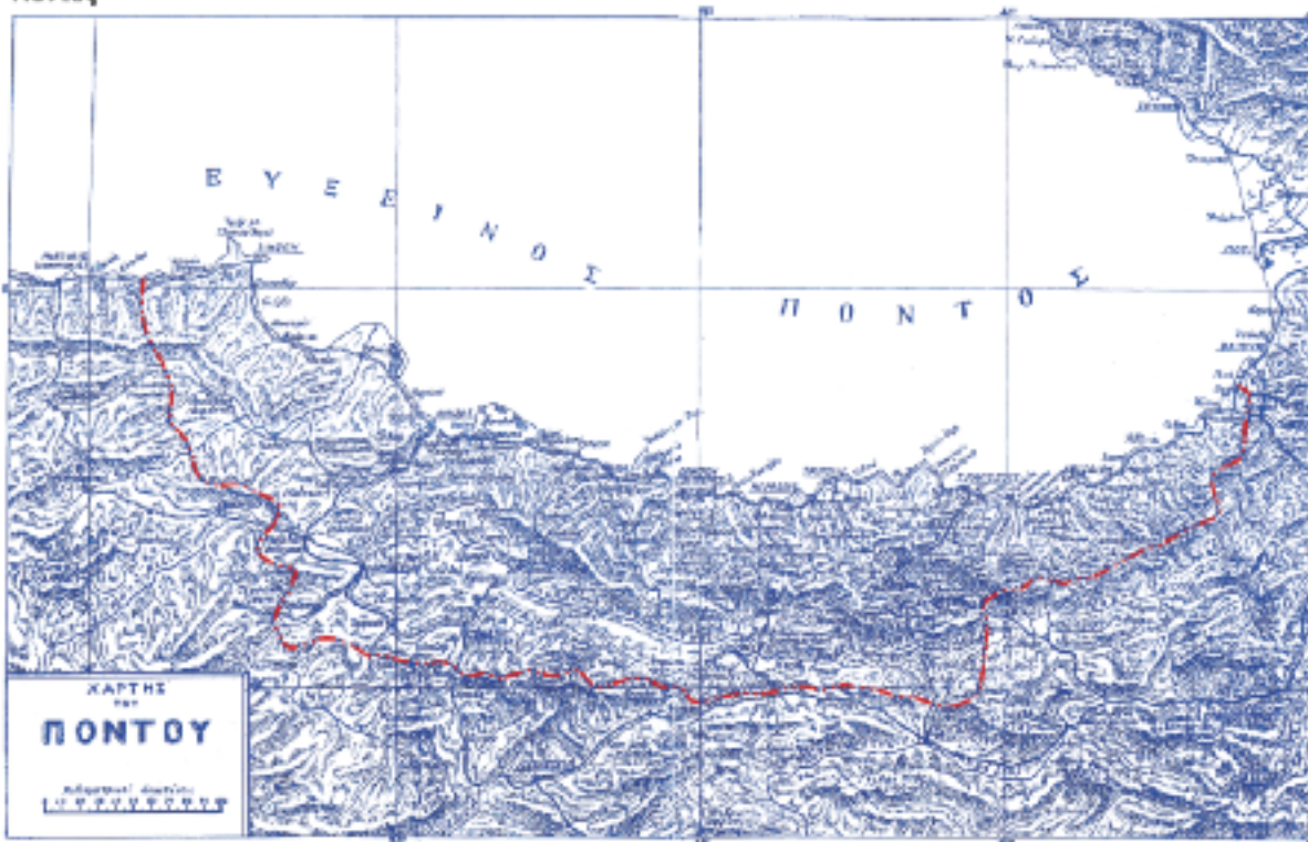
Χάρτης 1 Πόντος