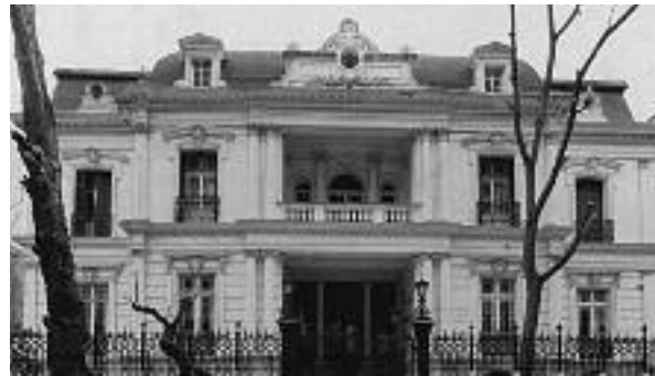
Εικ. 17. Η Οθωμανική Τράπεζα, 1904.

γάλες εταιρείες, ακτοπολική και αστική συγκοινωνία, διευκόλυναν την εξαιρετικά αυξημένη μεταπρατική και επιχειρηματική δραστηριότητα. Καινοτόμος ήταν και ο σχεδιασμός των νοσοκομείων (π.χ. Δημοτικό, Hirsh) με τη μορφή περιπτέρων και πτερύγων εκατέρωθεν του κεντρικού χώρου, για την αποτροπή μετάδοσης των ασθενειών (εικ. 18). Ο οικοδομικός οργασμός βασίστηκε σε μεγάλο ποσοστό σε ευρωπαϊκά κεφάλαια. Οι οργανισμοί κοινής ωφέλειας επίσης ιδρύθηκαν με τεχνογνωσία και χρηματοδότηση των ξένων κρατών, συνιστώντας έναν ακόμη τρόπο οικονομικής διείσδυσής τους.