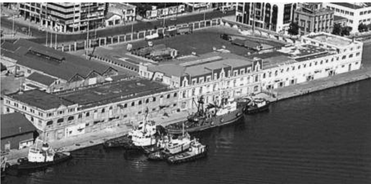
Εικ. 12β. Το Τελωνείο, 1910 (αρχιτ. Ε. Μοδιάνο).

Μνημειώδη δημόσια κτίρια άρχισαν να κοσμούν την πόλη. Η Σχολή στελεχών της οθωμανικής διοίκησης «Ιδαδιέ» (σημερινή παλιά Φι-