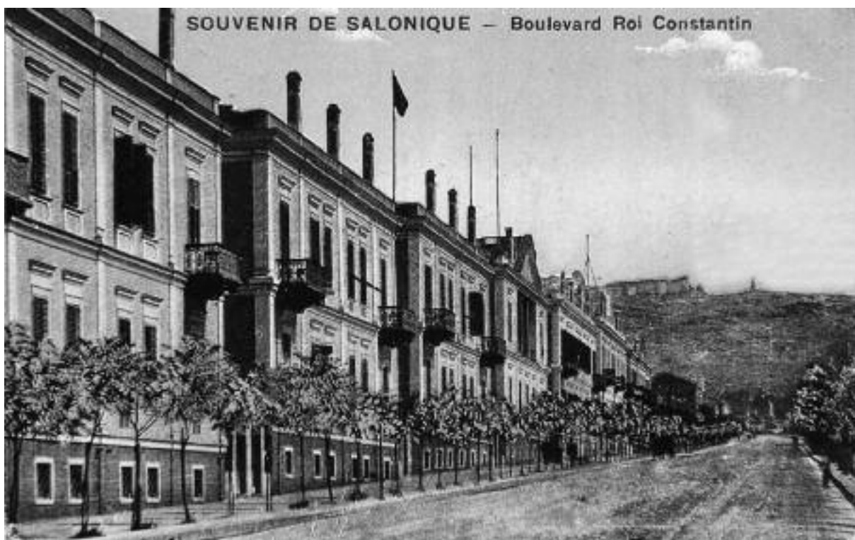
Εικ. 5. Η οδός Χαμιντιέ (σημ. οδός Εθνικής Αμύνης), 1889-1900.