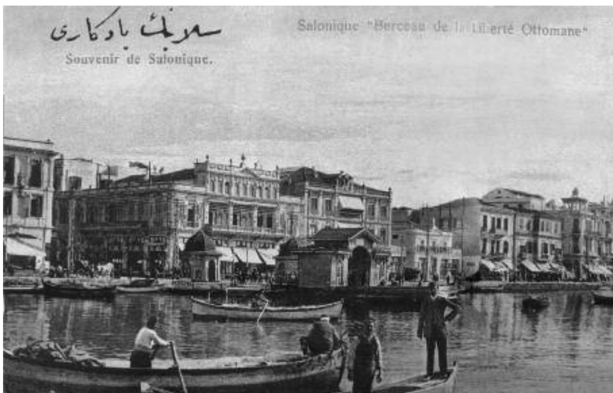
Εικ. 9. Άποψη της παραλίας.