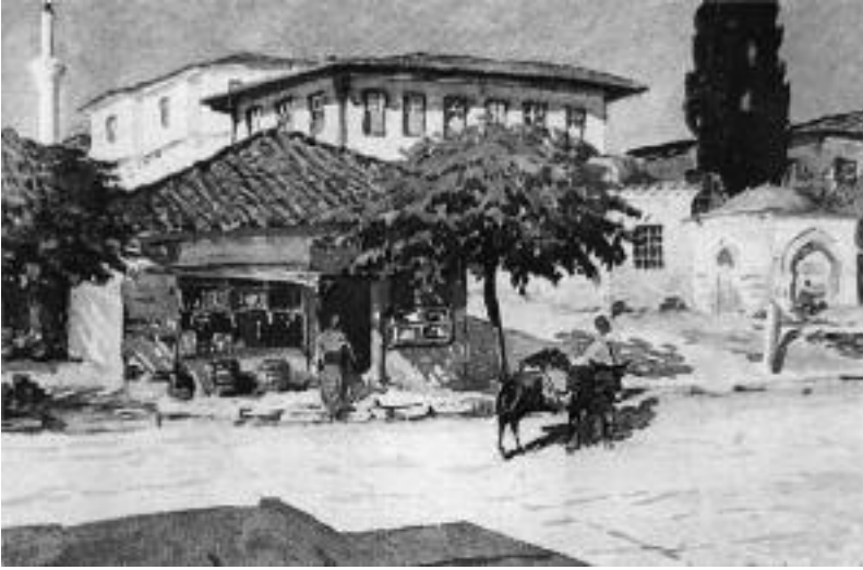
Εικ. 10. Κρήνη στην Άνω Πόλη.