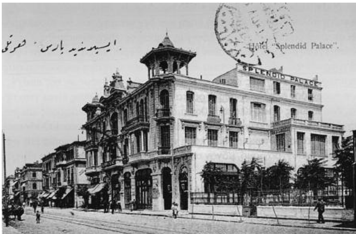
Εικ. 8. Το ξενοδοχείο Splendid Palace, 1907 (αρχιτ. Κ. Ρώμπαπας).