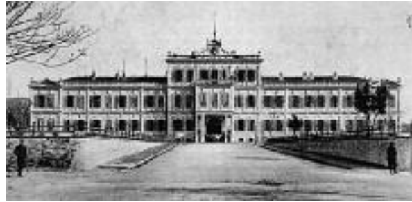
Εικ. 16. Το Στρατηγείο, 1903 (αρχιτ. V. Poselli).