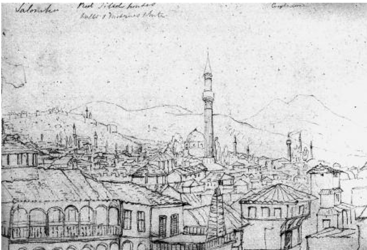
Εικ. 3. Charlotte Smith, 'Άποψη της Θεσσαλονίκης με την Αγία Σοφία και τα βορειοανατολικά τείχη, 1834, μολύβι, 17×24 εκ.

νωση των απαραίτητων υπηρεσιών. Δύο πασάδες, ο Σαμπρή 11 και ο Μιδχάτ 12 , συνέδεσαν τη θητεία τους (1869-1871 και 1873-1874 αντίστοιχα) με την απαρχή βελτιωτικών έργων και γι' αυτές τους τις προσπάθειες απέκτησαν δημοφιλία.