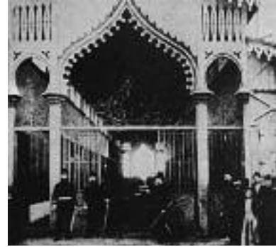
Εικ. 11. Το Δημοτικό Ιχθυοπωλείο στο λιμάνι, 1889.

μική διακόσμηση κτίστηκε (1889) στο λιμάνι (εικ. 11), όπως και μεταλλική αποβάθρα (εικ. 12α) στο παλιό Τελωνείο, το οποίο αντικαταστάθηκε από υποβλητικό, γαλλικής έμπνευσης κτίριο, μήκους 200 μέτρων (1910) (εικ. 12β), όπου ο μηχανικός Ελί Μοδιάνο πρωτοχρησιμοποίησε οπλισμένο σκυρόδεμα, υλικό που διαδόθηκε ευρέως όπως και οι μεταλλικές κατασκευές στους νέους αποθηκευτικούς και βιομηχανικούς χώρους. Σύγχρονες τεχνικές και μέθοδοι εφαρμόζονταν πλέον. Η οδός Σαμπρή (σημερινή Βενιζέλου) στεγάστηκε με εντυπωσιακή μεταλλική κατασκευή.