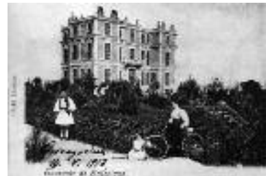
Εικ. 7β. Η βίλα Αλλατίνι, 1898 (αρχιτ. V. Poselli).