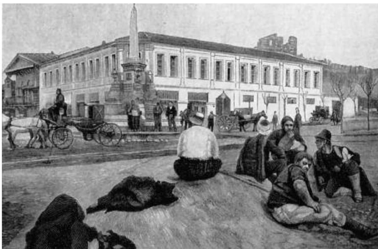
Εικ. 6. Το συντριβάνι της οδού Χαμιντιέ.