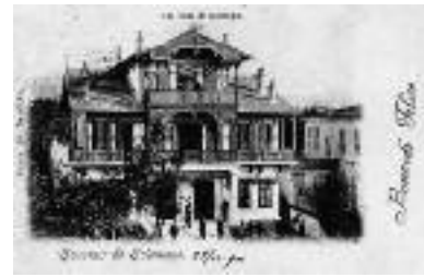
Εικ. 7α. Η βίλα Μπενουζίλιο, 1900 (αρχιτ. Τ. Ραζής).

Ο ανθυγιεινός τρόπος διανομής πόσιμου νερού και η υδροδότηση από τις κρήνες αντικαταστάθηκαν με δίκτυο ύδρευσης (1890-1892), όπως και ο φωτισμός με την εγκατάσταση εργοστασίου φωταερίου (1887-1892) και κατόπιν (1908) με ηλεκτρικό ρεύμα. Οι κρήνες που υμνήθηκαν από τον Κ. Μαλέα παρέμειναν για αρκετά μεγάλο χρονικό διάστημα, λίγες μάλιστα επιβίωσαν ως τις μέρες μας [π.χ. Άνω πόλη, Σιντριβάνι (εικ. 10)]. Σκεπαστό δημοτικό ιχθυοπωλείο με ισλα-