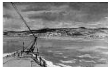
Εικ. 21. Sir David Muirhead Bone, N.E.A.C. Άποψη της Θεσσαλονίκης από τη θάλασσα, αρχές 20 ου αιώνα, υδατογραφία, 14 × 23 εκ.

Τα κύρια χαρακτηριστικά της διάρθρωσης τόσο της ελληνικής όσο και των άλλων κοινοτήτων είναι αναγκαίο σ' αυτό το σημείο να σκια-