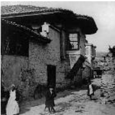
Εικ. 20. Άνω Πόλη.