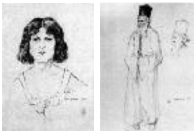
Εικ. 22, 23. Ruedolf, Πορτρέτο νέας Θεσσαλονικιάς, 196, μολύβι, 20 × 14,7 εκ. (αριστ.). Παπάς στη Θεσσαλονίκη, 1916-17, μολύβι, 23,2 × 17,5 εκ. (δεξ.).

21 Το επτατάξιο γυμνάσιο του 1873 απέκτησε ισοτιμία με τα γυμνάσια του ελληνικού κράτους. Το 1875 λειτουργούσαν ήδη γυμνάσιο, ένα παρθεναγωγείο, τρία νηπιαγωγεία. Το 1892 με δωρεά του Ανδρέα Συγγρού ιδρύθηκε το Α΄ γυμνάσιο και στελεχώθηκε με διακεκριμένους εκπαιδευτικούς όπως ο Μ. Δήμιτσας, Π. Παπαγεωργίου, Β. Μυστακίδης, Π. Κοντογιάννης, Ι. Δέλλιος, που το ανέδειξαν σε δραστήριο εκπαιδευτικό κέντρο με επιρροή σ' όλη τη Μακεδονία. Διέθετε αξιόλογη βιβλιοθήκη με χειρόγραφα από τον 16 ο αιώνα και μετά. Η Κεντρική Αστική Σχολή και η Ιωαννίδιος Αστική Σχολή (δωρεά Δ. Ιωαννίδη) ιδρύθηκαν το 1907 και δύο χρόνια αργότερα η Αστική Σχολή Αναλήψεως.