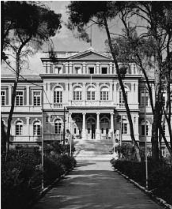
Εικ. 15. Το Παπάφειο Ορφανοτροφείο, 1903 (αρχιτ. Ε. Παιονίδης).