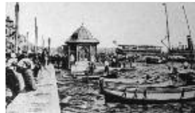
Εικ. 12α. Η αποβάθρα.

μική διακόσμηση κτίστηκε (1889) στο λιμάνι (εικ. 11), όπως και μεταλλική αποβάθρα (εικ. 12α) στο παλιό Τελωνείο, το οποίο αντικαταστάθηκε από υποβλητικό, γαλλικής έμπνευσης κτίριο, μήκους 200 μέτρων (1910) (εικ. 12β), όπου ο μηχανικός Ελί Μοδιάνο πρωτοχρησιμοποίησε οπλισμένο σκυρόδεμα, υλικό που διαδόθηκε ευρέως όπως και οι μεταλλικές κατασκευές στους νέους αποθηκευτικούς και βιομηχανικούς χώρους. Σύγχρονες τεχνικές και μέθοδοι εφαρμόζονταν πλέον. Η οδός Σαμπρή (σημερινή Βενιζέλου) στεγάστηκε με εντυπωσιακή μεταλλική κατασκευή.