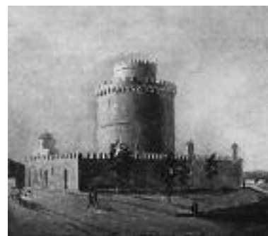
Εικ. 2. Άγνωστου, Άποψη του Λευκού Πύργου από τα δυτικά, 19 ος αιώνας, λάδι, 22×31 εκ.