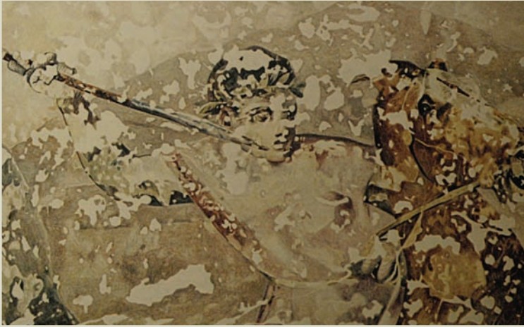
■ Οι Μακεδόνες ήταν έξοχοι ιππείς. Λεπτομέρεια από τη λεγόμενη “παράσταση του κυνηγιού”, Βεργίνα.