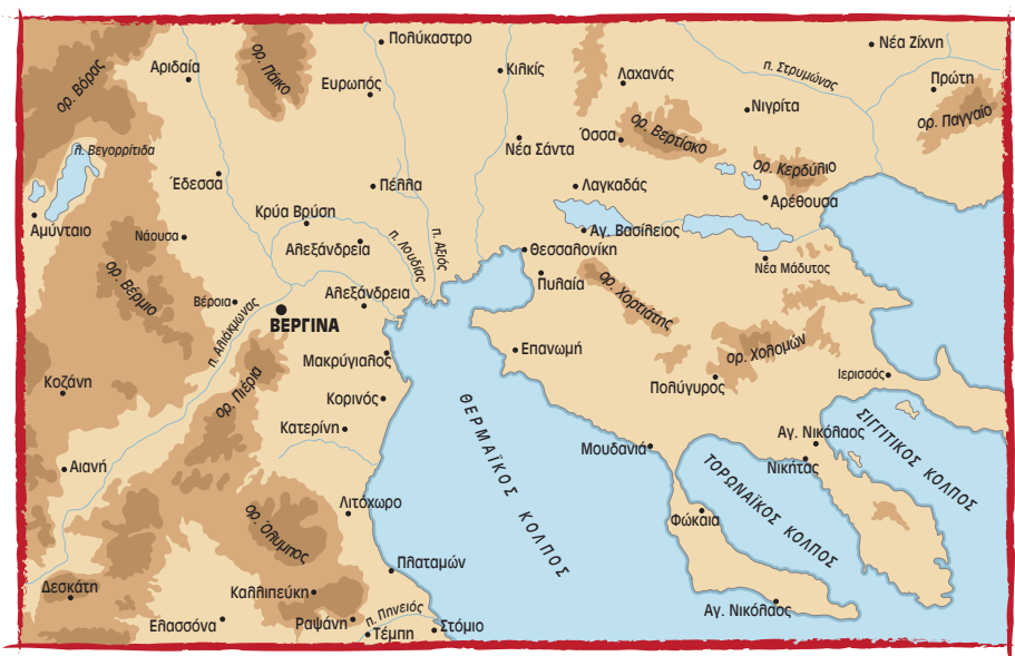
■ Χάρτης της Μακεδονίας, όπου σημειώνεται η θέση των Αιγών (Βεργίνα).

Νότια Ελλάδα με αυτόν που, ξεκινώντας από τα παράλια της Πιερίας και ακολουθώντας τους ορεινούς όγκους, οδηγούσε στον Βορρά και στην Ανατολή. Ισχυρά τείχη συμπλήρωναν την οχύρωσή της. Με τους Τημενίδες στην εξουσία, οι Μακεδόνες επέκτειναν την κυριαρχία τους και έγιναν κύριοι της πλούσιας χώρας που έμελλε να πάρει από αυτούς το όνομά της. Οι Αιγές, όντας το κέντρο ενός από τα πιο ισχυρά κράτη της περιοχής, συνδέθηκαν στενά με την τύχη του μακεδονικού βασιλείου και γνώρισαν μεγάλη ανάπτυξη τον 6 ο και τον 5 ο αιώνα π.Χ. Οικισμοί και νεκροταφεία, που βρέθηκαν διάσπαρτα στον κάμπο και στους γύρω χαμηλούς λόφους μετά τις ανασκαφές, φανερώνουν την πυκνή κατοίκηση της περιοχής ενώ τα αρχαιολογικά ευρήματα της νεκρόπολης αποκαλύ-