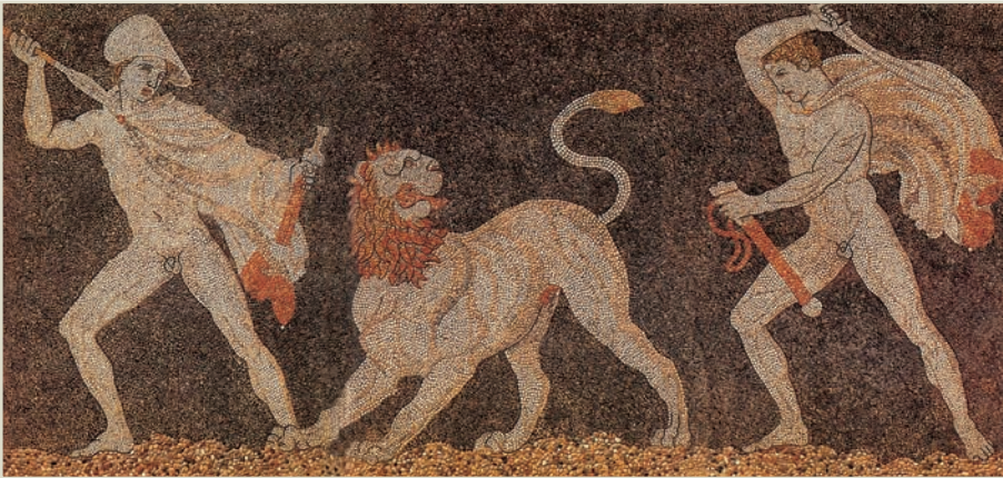
■ Ψηφιδωτό από την Πέλλα με παράσταση κυνηγιού.

Νομάδες οι περισσότεροι, απέκτησαν γρήγορα εκείνα τα χαρακτηριστικά που απαιτούνται για την ασφάλεια των μετακινήσεων και την αντιμετώπιση των κινδύνων: πειθαρχία και θάρρος.