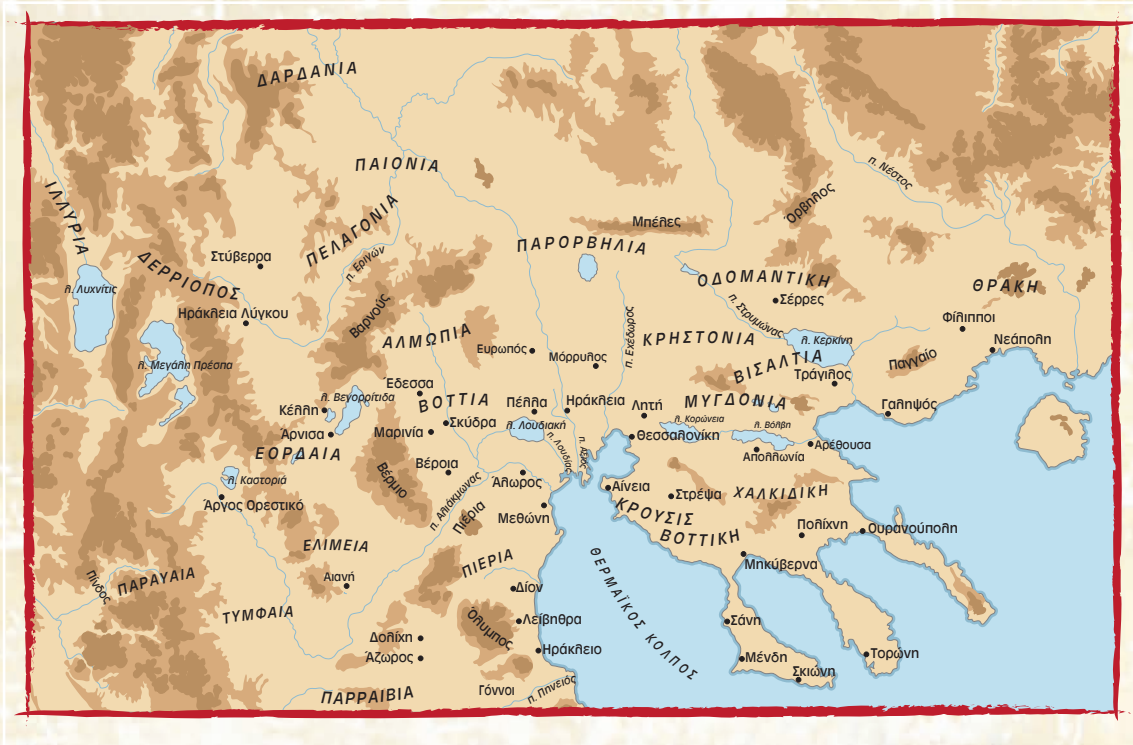
■ Γεωφυσικός χάρτης της Μακεδονίας.