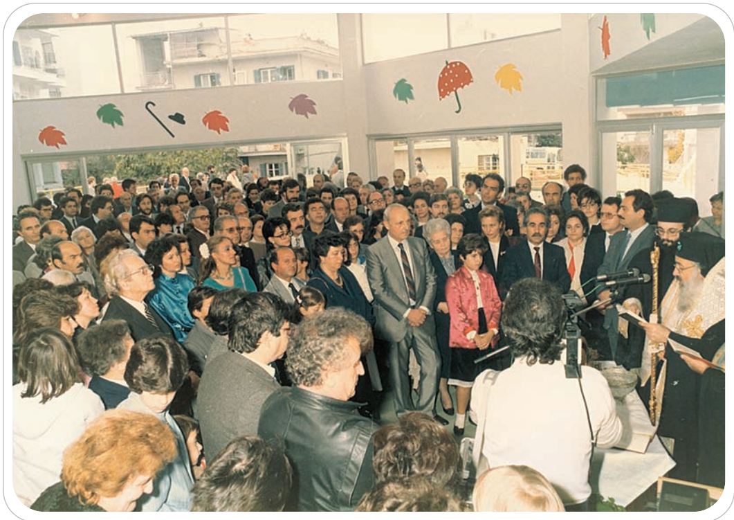
Η τελετή των εγκαινίων

Ξεκινώντας από την θέση την οποία πιο πάνω ανέφερα, ότι στο παιδί πρέπει να δώσουμε ό,τι καλύτερο μπορούμε και με τον καλύτερο δυνατό τρόπο, δεν αρκεστήκαμε να φτιάξουμε απλώς ένα συνηθισμένο σχολείο για να στεγαστεί ένας αριθμός παιδιών, που και αυτό βέβαια ήταν μία επιτακτική ανάγκη, αλλά προσπαθήσαμε να δώσουμε κάτι το πρωτότυπο, κάτι το ιδιαίτερο τόσο στην αρχιτεκτονική του δομή και την λειτουργικότητά του, όσο και στην ποιότητα της εργασίας, ώστε να αποτελέσει ένα παράδειγμα προς μίμηση. Θα ήμασταν ευτυχείς, αν αυτό για το οποίο τόσο πασχίσαμε να το παρουσιάσουμε σ' αυτή την μορφή, βρει απήχηση στις ψυχές των παιδιών και επιδοκιμασία στην κριτική των μεγάλων.