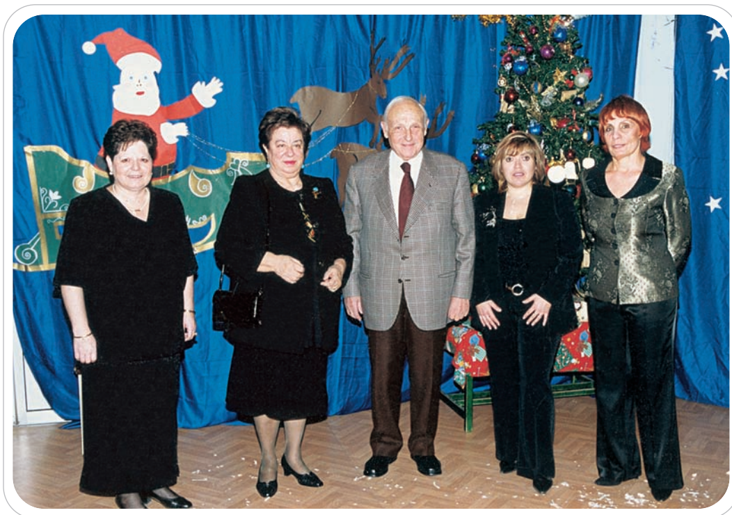
Γιορτή στο νηπιαγωγείο

Από την εσωτερική αυλή οδηγούμαστε στην εξωτερική από 3 εξόδους. Η έκταση αυτή είναι 522 τ.μ. και χωρίζεται σε 2 επίπεδα. Πλακόστρωτο το α' με 2 αμμοδόχους και πράσινο στο β' με παιδική χαρά και χώρο για ελεύθερο παιχνίδι. Στις