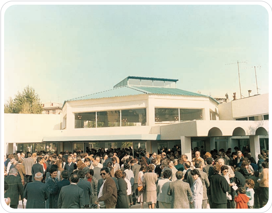
Άποψη του κοινού κατά τα εγκαίνια

για τις γιορτές των παιδιών, για συγκεντρώσεις γονέων και μαθητών, αλλά και για ευρύτερες μορφωτικές και πολιτιστικές εκδηλώσεις εξωσχολικές, όπως εκθέσεις, διαλέξεις, συζητήσεις, ακόμα και σεμινάρια, για τα οποία προσφέρεται ως ένας φωτεινός, ευχάριστος και ήσυχος χώρος.