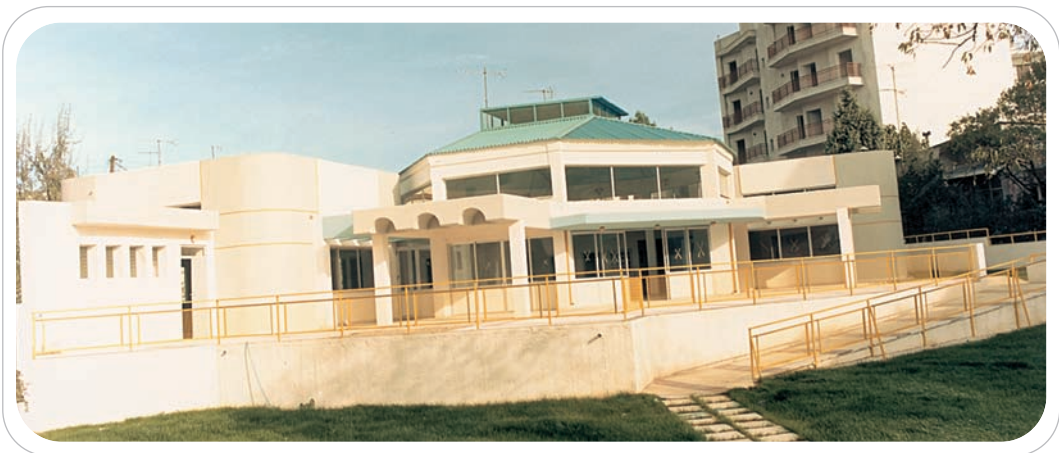
Όψη από την αυλή

Η πορεία της περάτωσης του διδακτηρίου απέδειξε την σημασία των ιδιωτικών πρωτοβουλιών που, όταν εναρμονίζονται με τους στόχους της πολιτείας και της τοπικής αυτοδιοίκησης, μπορούν να προσφέρουν σπάνιους σχολικούς χώρους και ολοένα καλύτερες εκπαιδευτικές διαδικασίες. Μπορούν γενικότερα να προσφέρουν αναβαθμισμένες κοινωνικές παροχές για τους κατοίκους αυτής της πόλης.