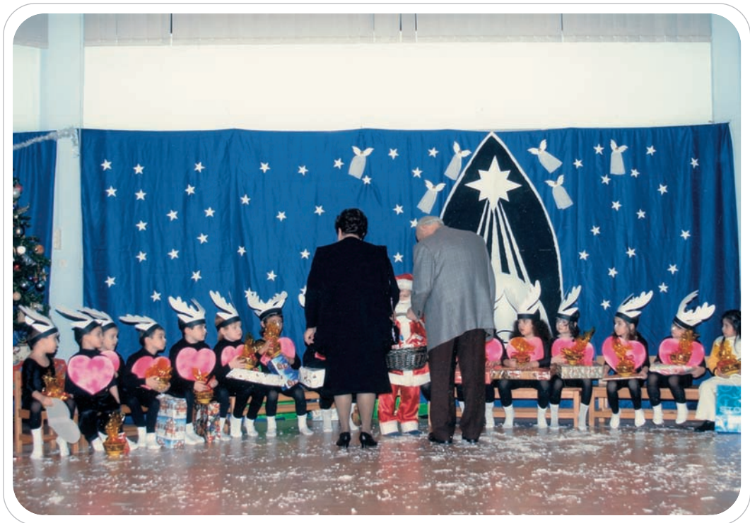
Γιορτή στο νηπιαγωγείο

Η κουζίνα του κτιρίου, πλήρως εξοπλισμένη για να εξυπηρετεί τις ανάγκες του ολοήμερου νηπιαγωγείου, εφόσον τα νήπια της κατηγορίας αυτής μένουν στο νηπιαγωγείο μέχρι τις πρώτες απογευματινές ώρες – 3.45' – έως ότου σχολάσουν οι γονείς τους από την εργασία τους. Ως εκ τούτου, τα νήπια παίρνουν πρόγευμα, γεύμα, το οποίο, αφού ζεσταθεί σε ειδικά σκεύη, σερβίρεται σε ατομικό δίσκο με πιάτο από ειδικό προσωπικό που μισθώνεται από τους γονείς. Γι' αυτό και διαθέτει ψυγείο για την φύλαξη των φαγητών, φούρνο ηλεκτρικό για το ζέσταμα και πλυντή-