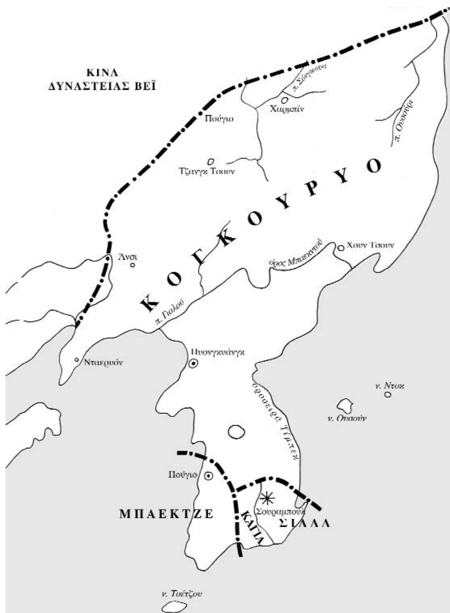
Εικόνα 1.2: Η χερσόνησος της Κορέας τον 6 ο αι. μ.Χ.