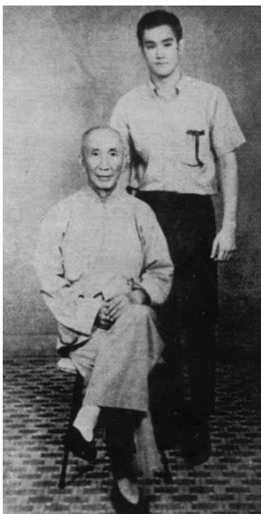
Εικόνα 1.3: Ο Μιχους Λη (1940-1973) τα χρόνια της μαθητείας του στο δάσκαλό του Γιπ Μαν (1893-1972).

ίνγκ Τσουν 44 και, κατόπιν, σε άλλα στυλ πολεμικών τεχνών, ενώ την περίοδο 1970-73 γύρισε τις συναρπαστικές για το δυτικό θεατή ταινίες του. Έτσι, οι ανατολικές πολεμικές τέχνες έγιναν μόδα εκείνη την εποχή και ενέπνευσαν πολλούς νέους σε όλο τον κόσμο να ασχοληθούν με αυτές. Ακολούθησε, βέβαια, μετά το θάνατό του εμπορική εκμετάλλευση αυτής της τάσης τόσο από τον κινηματογράφο και τα έντυπα μέσα, όσο και από νεοφώτιστους ψευτοδασκάλους, που επαίρονταν για τη γνώση τους σε αυτές τις, εξωτικές για τη Δύση, τέχνες. Οι αυθεντικές, όμως, ανατολικές πολεμικές τέχνες είχαν, ήδη,