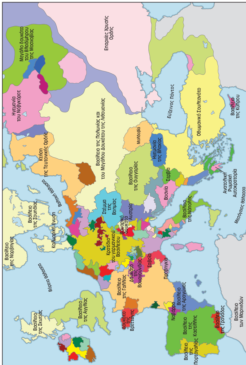
Η Ευρώπη στα 1200.