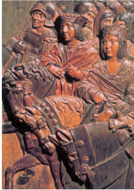
Οι Ισπανοί Βασιλείς: Φερδινάνδος της Αραγόνας και Ισαβέλλα της Καστίλλης.

Από τα βασικά γνωρίσματα των νέων εθνικών μοναρχιών, εκτός της εθνικής γλώσσας που επέβαλαν και καλλιέργησαν στην επικράτεια της η καθεμιά, υπήρξε η μόνιμη κρατική διοίκηση, ένα σύστημα υπηρεσιών που προήλθε από τους διάφορους αξιωματούχους του ηγεμόνα και των αριστοκρατών. Η μονιμότητα αυτών των υπηρεσιών και η σταδιακή τους απομάκρυνση από τον άμεσο έλεγχο ή την εποπτεία του ηγεμόνα είχαν ως συνέπεια να μετεξελιχθούν από ομάδες αξιωματούχων αφοσιωμένων στον ίδιο σε πραγματικές δημόσιες υπηρεσίες, ανεξάρτητες και ανεπηρέαστες από την εναλλαγή των βασιλέων στον θρόνο της