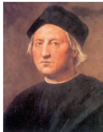
Ο Χριστόφορος Κολόμβος (1451-1506).

Από τα βασικά γνωρίσματα των νέων εθνικών μοναρχιών, εκτός της εθνικής γλώσσας που επέβαλαν και καλλιέργησαν στην επικράτεια της η καθεμιά, υπήρξε η μόνιμη κρατική διοίκηση, ένα σύστημα υπηρεσιών που προήλθε από τους διάφορους αξιωματούχους του ηγεμόνα και των αριστοκρατών. Η μονιμότητα αυτών των υπηρεσιών και η σταδιακή τους απομάκρυνση από τον άμεσο έλεγχο ή την εποπτεία του ηγεμόνα είχαν ως συνέπεια να μετεξελιχθούν από ομάδες αξιωματούχων αφοσιωμένων στον ίδιο σε πραγματικές δημόσιες υπηρεσίες, ανεξάρτητες και ανεπηρέαστες από την εναλλαγή των βασιλέων στον θρόνο της