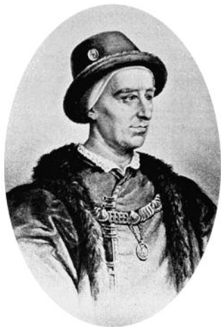
Ο Λουδοβίκος ΙΑ΄ της Γαλλίας.