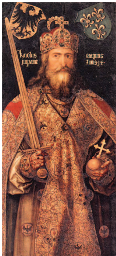
Ο Κάρολος ο Μέγας ή Καρλομάγνος (742/7-814).

περιεχόμενό τους. Ο όρος Ευρώπη, μετά την αρχαιότητα, απαντάται με αυξανόμενη συχνότητα από τα μέσα περίπου του Η' αιώνας, ιδίως σε αναφορές στον Κάρολο (γενναίος στρατιώτης στην αρχαία Γερμανική), που επονομάσθηκε 'Μεγάλος' και έμεινε γνωστός ως Καρλομάγνος. Αναφέρεται, λοιπόν, ο Καρλομάγνος ως βασιλεύς της Ευρώπης ή ηγεμών της Ευρώπης, καθώς και ως σεβαστός ηγέτης της Ευρώπης. Επρόκειτο, φυσικά, για τον 'ηγεμόνα' της Δυτικής Ευρώπης, η οποία διακρινόταν από την Ανατολική Ρωμαϊκή Αυτοκρατορία. Η διάκριση αυτή πήρε τη μορφή έντονου θρησκευτικού και πολιτικού ανταγωνισμού τον Θ' αιώνα και κορυφώθηκε με το Σχίσμα των εκκλησιών, κατ' αρχάς το 867 και οριστικά το 1054. Σήμερα ο όρος Ευρώπη δεν σημαίνει πλέον τη θρησκευτική ενότητα του παρελθόντος, αλλά σύστημα αξιών,