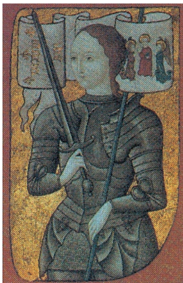
Ιωάννα της Λωραίνης (Zan vt' Arx) (1412-1431).

Την τελική ώθηση προς τη διαμόρφωση των χαρακτηριστικών και των μηχανισμών του εθνικού κράτους στην Αγγλία και τη Γαλλία έδωσε