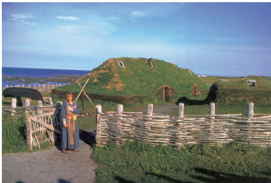
Ανακατασκευή οικίας Βίκινγκ.

Άλλες πολιτιστικές συνεισφορές στην ευρωπαϊκή ιστορική ενότητα και πολιτική ταυτότητα, λιγότερο εμφανείς από αυτές που αναφέρθηκαν πιο πάνω, είναι οι συνεισφορές των Σαρακηνών (από την αραβική λέξη sark : Ανατολή), όπως ο αραβικός ίππος, το πρόβατο μερινός, πλήθος λαχανικών και φρούτων και, πάνω απ' όλα, η χρήση του χαρτιού (εφεύρεση των Κινέζων), ή αυτές των Βίκινγκς (από την Αρχαιογεωμα-