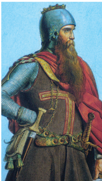
Ο αυτοκράτορας Φρειδερίκος Α΄ (Βαρβαρόσας).

Από τους συντελεστές που διαμόρφωσαν την πολιτική φυσιογνωμία της Ευρώπης περισσότερο από κάθε άλλον, από τους μέσους χρόνους και εξής, υπήρξε ο ανταγωνισμός μεταξύ της κοσμικής και της θρησκευτικής εξουσίας. Ο ανταγωνισμός αυτός, ο οποίος εκδηλώθηκε πρώτα προκειμένου για την ενθρόνιση των επισκόπων από τον κοσμικό ηγεμόνα ή από τον θρησκευτικό ηγέτη, κατέληξε στον συμβιβασμό της διπλής ενθρονίσεως και στην αποδοχή της αρχής που προβλέπει τη διάκριση των δύο εξουσιών με αναφορά στην ευαγγελική ρήση «Τα του Καίσαρος τω Καίσαρι, τα του Θεού τω Θεώ».