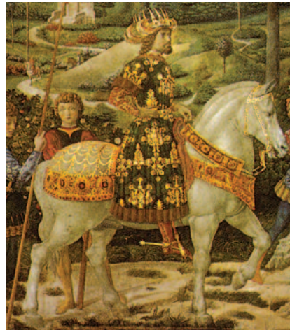
Ο Ιωάννης Η΄ Παλαιολόγος στη Σύνοδο της Φερράρας.

Η Ευρώπη αποτελεί ιστορική ενότητα που προσδιορίζεται με πολιτιστικούς μάλλον και πολιτικούς παρά γεωγραφικούς όρους, παρόλο που δεν υπάρχει συμφωνία μεταξύ των ιστορικών ως προς τις αξίες και τις αρχές που προσδιορίζουν αυτήν την ενότητα. Κατά την αρχαιότητα, η Ευρώπη ήταν γνωστή μόνον ως γεωγραφική ενότητα. Με την πολιτιστική της σημασία η ήπειρος διαμορφώθηκε κατά τη διάρκεια του Μεσαίωνα και προήλθε από την εξάρθρωση της Ρωμαϊκής Αυτοκρατορίας, την εξάπλωση των Μουσουλμάνων στις ασιατικές και τις βορειοαφρικανικές επαρχίες της αυτοκρατορίας που αχρήστευσε την ανατολική Μεσόγειο ως διάυλο επικοινωνίας με την Ασία, και την κάθοδο των Σλάβων στη Νοτιοανατολική Ευρώπη που απέκλεισε τις χερσαίες επικοινωνίες του δυτικού τμήματος της αυτοκρατορίας με το ανατολικό της τμήμα. Αποκλεισμένοι από τα πολιτιστικά κέντρα της Ανατολής οι βάρβαροι της Δυτικής και της Κεντρικής Ευρώπης ανέ-