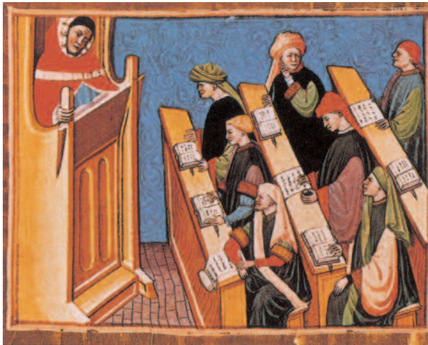
Διδασκαλία στο Πανεπιστήμιο της Μπολόνιας (1400).

Την ίδια εποχή, τον ΙΒ΄ και ιδίως τον ΙΓ΄ αιώνα και στο πνεύμα των αδελφοτήτων που αναπτύχθηκε τότε, εμφανίσθηκαν και τα πρώτα πανεπιστήμια. Το πανεπιστήμιο (Universitas) ήταν η συνολική κοινότητα των καθηγητών και των φοιτητών, μια αδελφότητα αφοσιωμένη στην καλλιέργεια της γνώσεως. Τα πρώτα αυτά πανεπιστήμια είχαν πραγματικό ευρωπαϊκό χαρακτήρα: οι φοιτητές των μετακινούνταν διαρκώς από πανεπιστήμιο σε πανεπιστήμιο. Από τον ΙΔ΄ αιώνα τα ευρωπαϊκά πανεπιστήμια προσέλαβαν περισσότερο εθνικό χαρακτήρα, αλλά συνέχισαν να καλλιεργούν τα αρχικά γνωστικά τους αντικείμενα, το Ρωμαϊκό και το Κανονικό Δίκαιο. Από τα πρώτα πανεπιστήμια που ιδρύθηκαν στην Ευρώπη ήταν αυτά της Μπολόνιας (1158), των Παρισίων