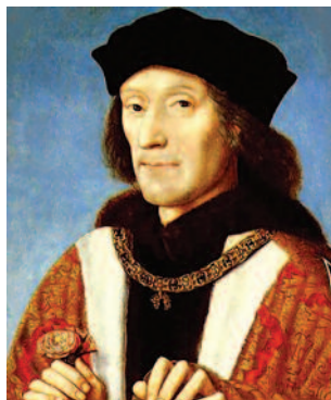
Ο Ερρίκος Ζ΄ της Αγγλίας.

ηγεμόνες να ενοποιήσουν την επικράτειά τους οι δε Άγγλοι να επιβεβαιώσουν τον έλεγχο τους στην δική τους νησιωτική επικράτεια με την καταστολή πλήθους αριστοκρατικών εξεγέρσεων. Η μοναρχία έγινε ακόμη πιο ισχυρή στις δύο χώρες, στις δεκαετίες που ακολούθησαν τη λήξη του πολέμου, στη Γαλλία επί Λουδοβίκου ΙΑ΄ (1461-1483) και στην Αγγλία επί Ερρίκου Ζ΄ (1485-1509).