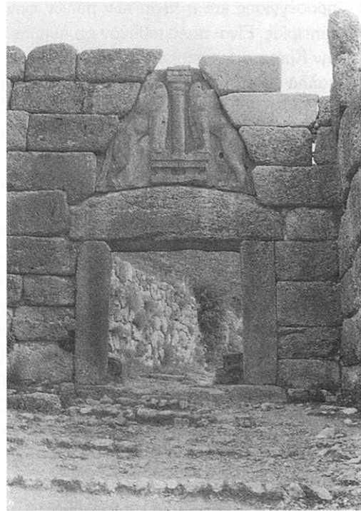
Εικ. 3. Μυκίνες, πρόσοψη της πύλης των Λεόντων.

νέους οικισμούς – μεταξύ άλλων Βρόκαστρο, Καβούσι, Δρήρος και Καρφι (εικ. 4) 9 – όπου οι παλαιοί τρόποι πυκνής δόμησης και οι παλαιοί τύποι σπιτιών συνέχισαν να υπάρχουν. Αλλά και στην ίδια την Ελλάδα, μετά το τέλος του μυκηναϊκού πολιτισμού, επέζησαν παλαιότεροι οικισμοί σε πολλά μέρη, κυρίως όμως στους πολυάριθμους τόπους λατρείας – όπως στους Δελφούς, στην Ολυμπία και στη Δήλο, γεγονός που συνδέεται συχνά με την αντικατάσταση μιας γυναικείας θεότητας, που λατρευόταν προηγουμένως εκεί, από μια ανδρική θεότητα – όπως συνέβη στους Δελφούς, στη Δήλο και στην Κέα 10 . Επίσης, οι παλαιοί τάφοι των ηγεμόνων που σώζονταν ακόμη, φαίνεται να απέκτησαν τώρα λατρευτική σημασία. Ωστόσο, παρά το γεγονός αυτής της συνέχειας, η σκοτεινή φάση από τον 12ο μέχρι τον 10ο αι. π.Χ., που συνδέεται με τη δωρική κάθοδο, αποτέλεσε βαθιά τομή, κυρίως για την αρχιτεκτονική. Μόλις τον 10ο αι. αρχίζουν σταδιακά να επανεμφανίζονται δείγματα αρχιτεκτονικής, αλλά σε πολύ μικρές διαστάσεις 11 , και το βέβαιο είναι ότι αρκετά κενά εδώ αποτελούν απλώς κενά της αρχαιολογικής έρευνας.