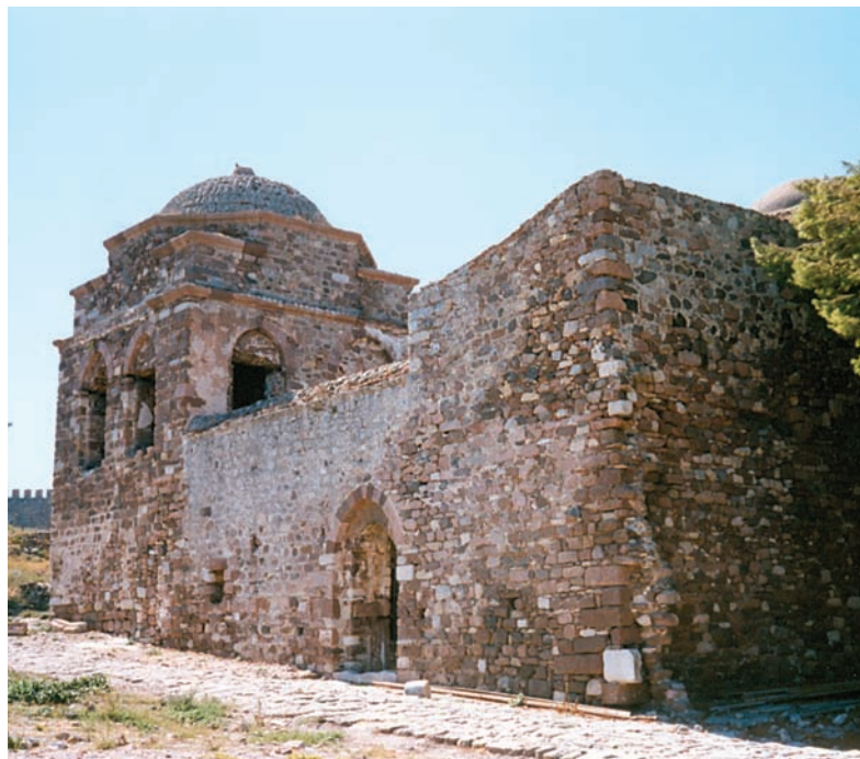
11. Ο μεντρεσές Μυτιλήνης, 2001. The medrese of Mytilene, 2001.

οθωμανικά μνημεία κατά μέσο όρο κάθε χρόνο, που είναι πάλι αποτέλεσμα της νέας αύξησης του αριθμού των Εφορειών Βυζαντινών Αρχαιοτήτων, οι οποίες, το 1977, ανέρχονται πλέον σε δεκατρείς, καθώς και των Εφορειών Νεωτέρων Μνημείων που ανέρχονται στις επτά (από μία). Επίσης συμβάλλει η διεύρυνση των αντικειμένων προστασίας στα οποία περιλαμβάνονται πλέον οι παραδοσιακοί οικισμοί, τα σπίτια της εποχής της τουρκοκρατίας αλλά και τα νεότερα.