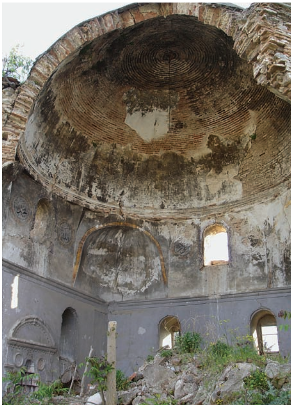
6. Το τζαμί Αχμέτ μπή στο στρατόπεδο Καψάλη Γιαννιτσών, 2007. The mosque Ahmet bey in Kapsali's armory of Giannitsa, 2007.