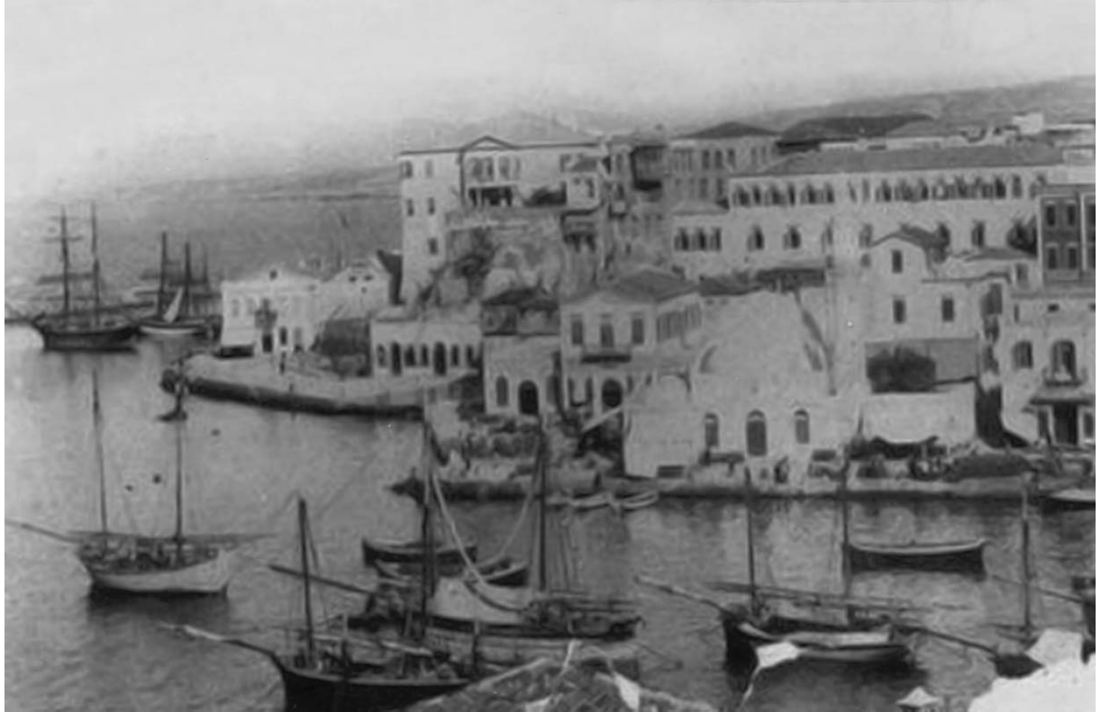
Η ευρύτερη περιοχή του διοικητηρίου Χανίων.