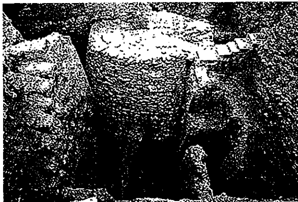
Εικόνα 8. Ιερικό, Παλαιστίνη. Κυκλικός πύργος (8.000 π.Χ.). Η «πρώτη» γνωστή πόλη στην Ιστορία.