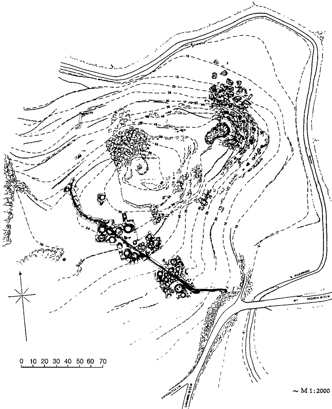
Εικόνα 10. Χοιροκειτία, Κύπρος. Κυκλικά κτίσματα και κεντρική λεωφόρος.