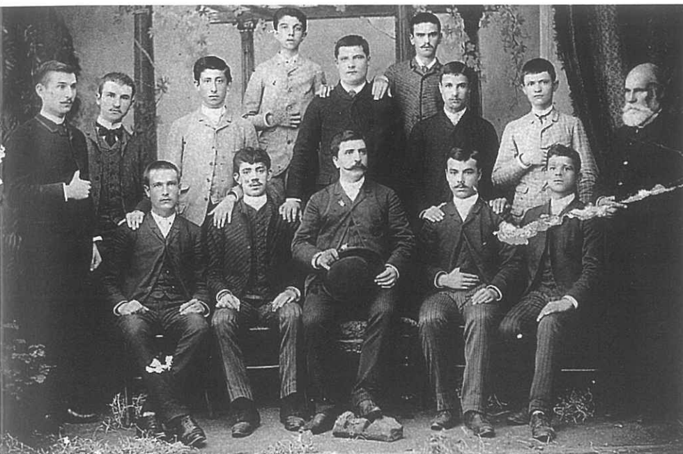
Απόφοιτοι του Ελληνικού Γυμνασίου Θεσσαλονίκης του 1900. Φωτογραφία Μ. Λιόντα. Δημοσιεύτηκε από τον Χ. Ζαφείρη.