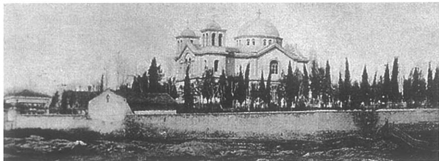
ΕΙΚΟΝΑ 2: Ο ναός της Αγίας Παρασκευής και το κοιμητήριο στις αρχές του αιώνα.

Εγκαινιάζεται τον Απρίλιο το νέο ορθόδοξο νεκροταφείο, στη θέση του παλαιού αγιάσματος της Αγίας Παρασκευής. Ο τόπος χρησίμευε από την αρχαιότητα ως κοιμητήριο, η χρήση του όμως είχε