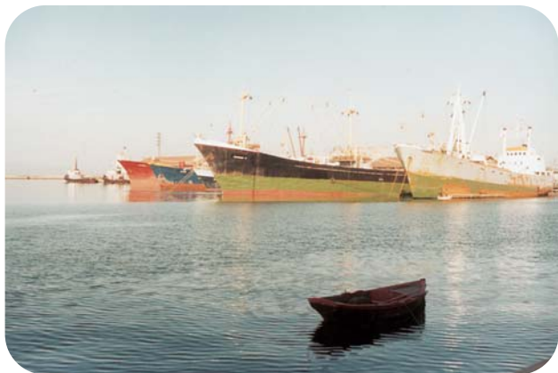
Πρόσφατη εικόνα του λιμανιού με μεγάλα πλοία.