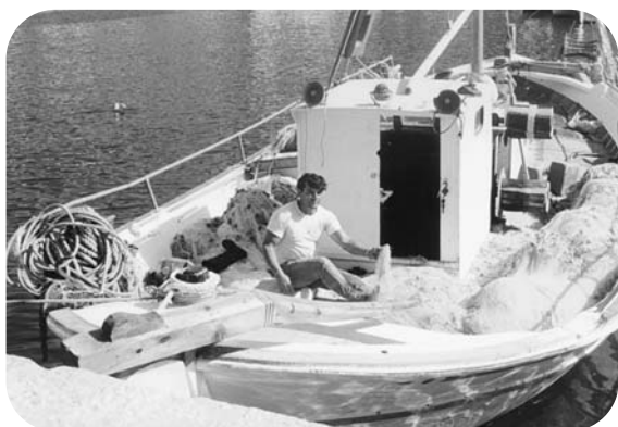
Ψαράδικο καράβι. Τέτοια καράβια δεν έρχονται πια στην παραλία μας.