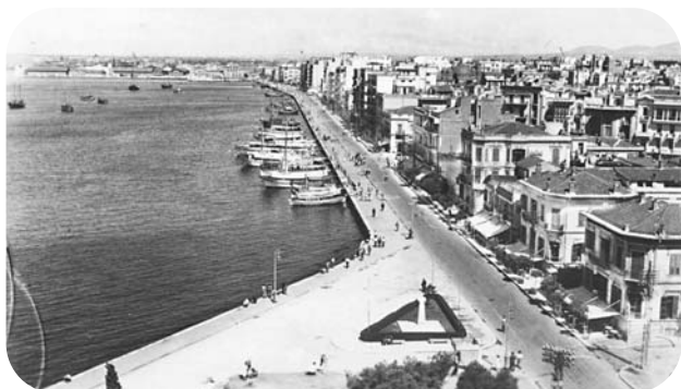
Εικόνα της παραλίας από παράθυρο του Λευκού Πύργου. Φαίνονται τα βαποράκια που πήγαιναν στην απέναντι ακτή.

Στην Περαία και τον Μπαζέ στήναμε ατομικό αντίσκηνο για να κάνουμε «φτηνές διακοπές».