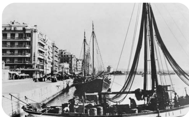
Καράβια στην παραλία, πριν από το 1950.