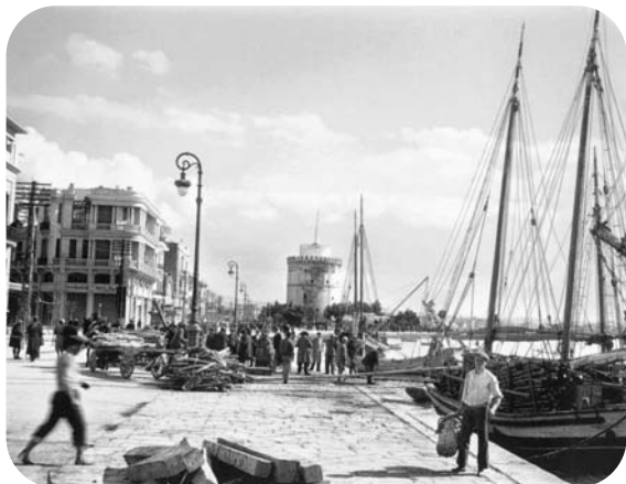
Εικόνα της παραλίας με τα καράβια και τα κάρα, πριν από το 1950.