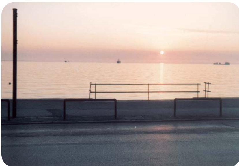
Η Θεσσαλονίκη φημίζεται για τα ωραία ηλιοβασιλέματα.

Σε πίνακα του λαϊκού ζωγράφου Ζήση απεικονίζεται η παραλία και ένας πλανόδιος λεμονατζής.