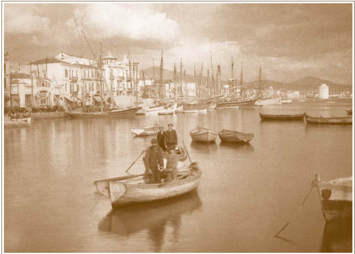
Η Θεσσαλονίκη του 1913 από την θάλασσα.

Θα πρέπει να σημειωθεί ότι όλες αυτές οι εφημερίδες έχουν να αντιμετωπίσουν ένα “καθεστώς” ελάχιστα ενθαρρυντικό για την ελευθεροτυπία καθώς ο νόμος ΔΞΘ/1912 “Περί καταστάσεως πολιορκίας” και ένα σχετικό β.δ. καθορίζουν τους όρους της κυκλοφορίας των εφημερίδων της πόλης, απαγορεύοντας την “παραμόρφωσιν των πληροφοριών των σχετικών με τα στρατιωτικά ζητήματα”. Όπως μας πληροφορεί μάλιστα η “Ν.Α.” (14.12.1912) μια μορφή λογοκρισίας θα επιβληθεί και επί του προφορικού λόγου και των ανα-