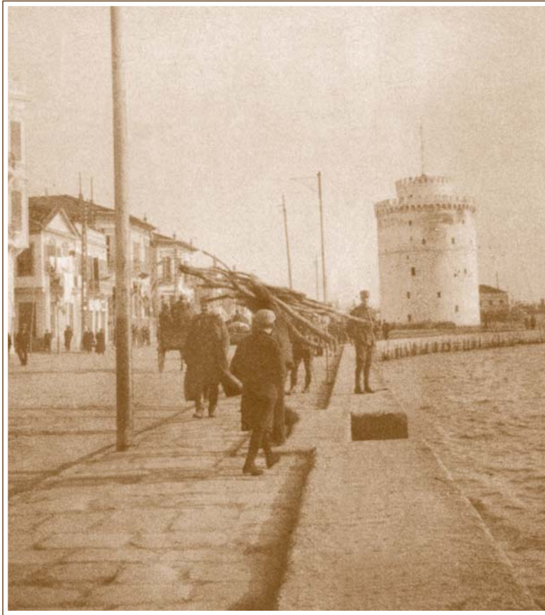
Ο Φιλ. Δραγούμης στο Λευκό Πύργο (Νοέμβριος 1912).

ται τους πολυπληθείς επισκέπτας και εμπνέει σεβασμόν σε δικούς του και ξένους. (...) Εκείνο όμως που δίνει ιδιάζοντα τόνο στην πόλη είναι οι πολλές Αθηναϊκές φυσιογνωμίες. Αλλά και από το εξωτερικόν και από την Αίγυπτο πάρα πολλοί, ιδίως από την Αλεξάνδρεια. (...)