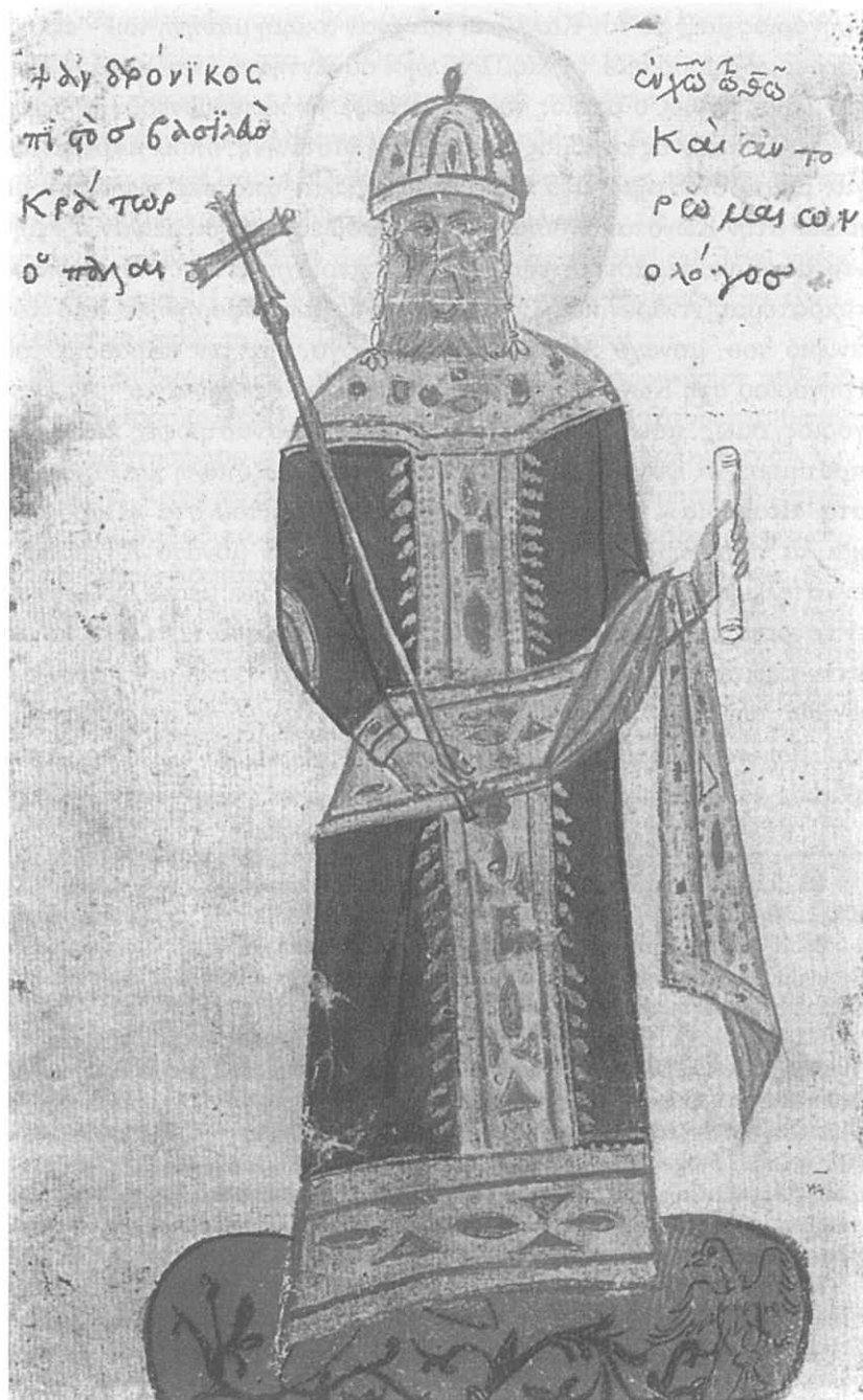
Ο αυτοκράτορας Ανδρόνικος Β΄ Παλαιολόγος (1282-1328). Μικρογραφία σε χειρόγραφο της Χρονογραφίας του Ιω. Παχυμέρη, το οποίο βρίσκεται στην Κρατική Βιβλιοθήκη της Βαυαρίας (Μόναχο).