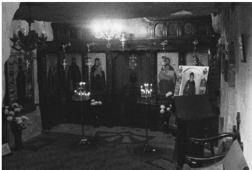
Εικόνα 4. Το εσωτερικό του ναού του οσίου Δημητρίου από το σπήλαιο του Μπασαραμπόβ.

σα στον βράχο όπου μόνασε ο όσιος Δημήτριος. Κάποια στιγμή, στην εποχή της Τουρκοκρατίας, το μοναστήρι ερειπώθηκε και έπαψε να έχει μοναχούς. Οι πρώτες προσπάθειες επανίδρυσης άρχισαν στις αρχές του 20ού αιώνα και από το 1937 εγκαταστάθηκε εκεί ο ιερομόναχος Χρύσανθος, ο οποίος και το ανακαίνισε 7 .