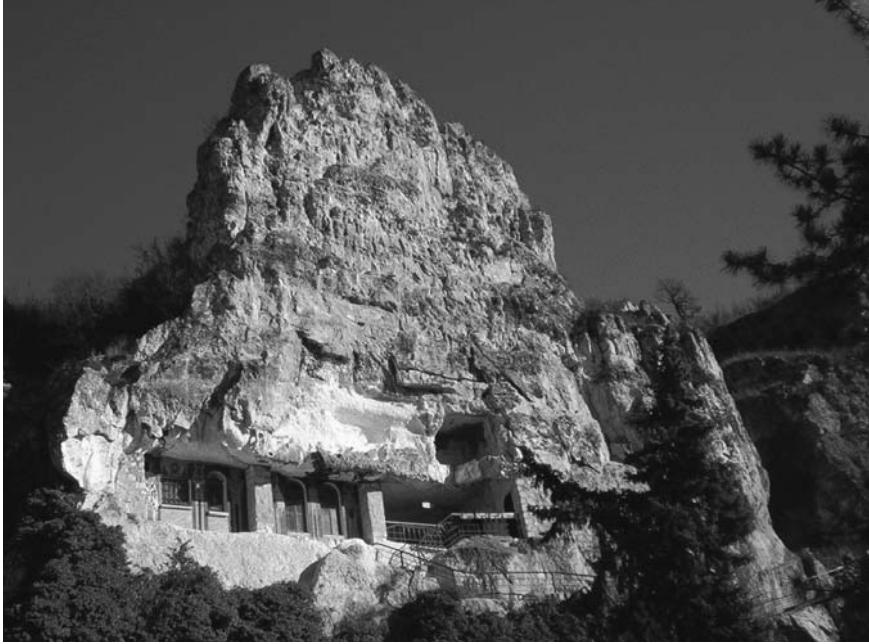
Εικόνα 2. Το σπήλαιο του οσίου Δημητρίου στο Μπασαραμπόβ.

Άγιος που διδάσκει με τον βίο του είναι και ο όσιος Δημήτριος ο Νέος, γνωστός και ως Μπασαραμπόβ, από τον τόπο στον οποίο μόνασε και αγίασε. Το Μπασαραμπόβ βρίσκεται σήμερα στην Βουλγαρία και απέχει μόνο δύο ώρες οδοιπορίας από την πόλη Ρούσε (5 χιλιόμετρα) η οποία βρίσκεται στις όχθες του Δούναβη που είναι το φυσικό σύνορο ανάμεσα στην Βουλγαρία και την Ρουμανία 1 . Το Μπασαραμπόβ άρχισε να γίνεται γνωστό μετά την κοίμηση του οσίου, όταν πολύς κόσμος πήγαινε εκεί για προσκύνημα. Στη μεθόριο του χωριού όπου βρίσκεται το σπήλαιο στο οποίο ασκήθηκε ο Όσιος, σήμερα λειτουργεί ανδρικό μοναστήρι.