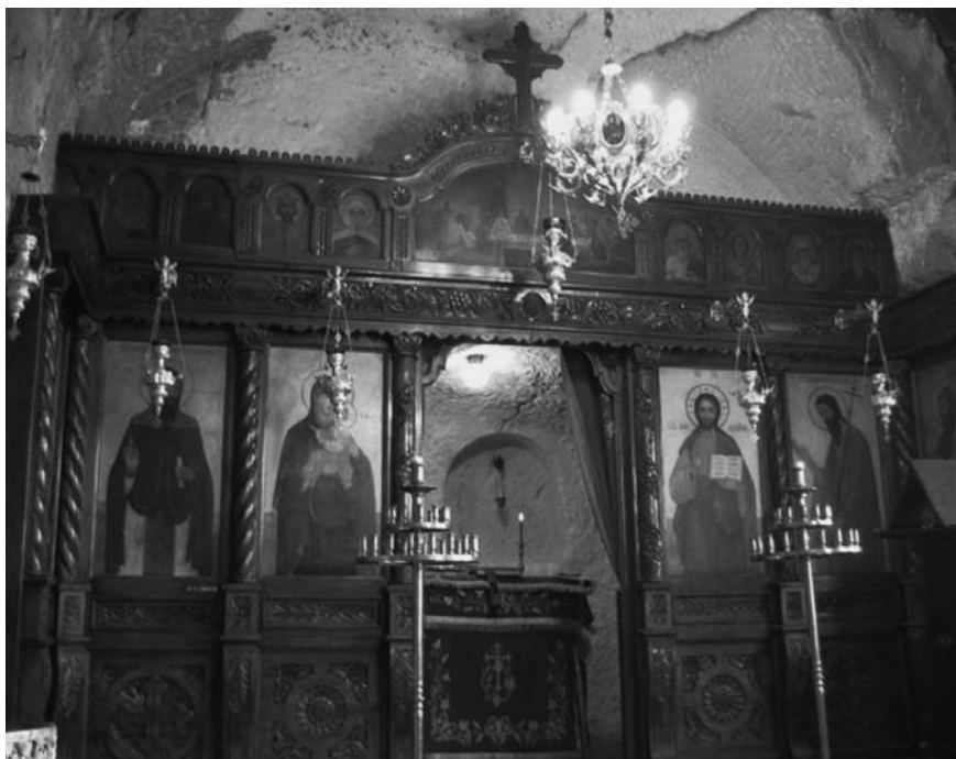
Εικόνα 5. Το τέμπλο του ναού του οσίου Δημητρίου στο σπήλαιο του Μπασαραμπόβ.

μόνασε ο όσιος και το πηγάδι το οποίο διανοίχτηκε από τον ίδιο. Στο πηγάδι αυτό αποδίδονται θαυματουργικές ιδιότητες. Το σπήλαιο του οσίου Δημητρίου επισκέφθηκε στις 21 Μαΐου 1953 ο πατριάρχης της Ρουμανίας Ιουστινιανός, ο οποίος χάρισε στο καθολικό της μονής ένα δισκοπότηρο και μία ιερατική στολή. Στην συνοδεία του ήταν και ο βοηθός πατριάρχου Θεόκτιστος, μετέπειτα πατριάρχης Ρουμανίας. Στις 26 Οκτωβρίου 2005, ο βοηθός του Πατριάρχου Βαρσανούφιος, με την ευλογία του πατριάρχου Ρουμανίας Θεόκτιστου, χάρισε στο μοναστήρι μία εικόνα του Οσίου μαζί με ένα τεμάχιο τιμίου λειψάνου του και την επόμενη ημέρα μαζί με τον μητροπολίτη Ρούσε Νεόφυτο τέλεσαν την Θεία Λειτουργία.