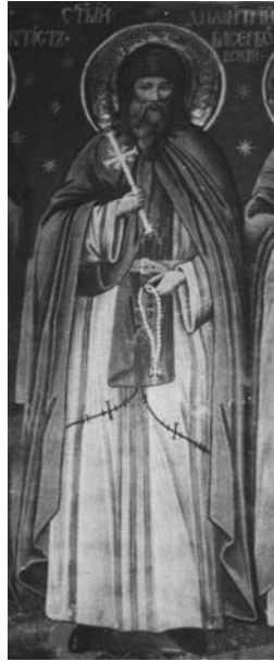
Εικόνα 7. Η νωπογραφία του οσίου Δημητρίου στο καθολικό της Ιεράς Μονής Ζωγράφου - Αγίου Όρους (1817).

αυτοί οι χρονολογικοί προσδιορισμοί για τον όσιο να οφείλονται σε σύγχυση με άλλους ομώνυμους αγίους.