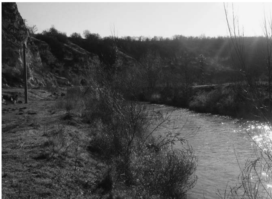
Εικόνα 3. Το ποτάμι του Λώμ που περνάει μπροστά από το σπήλαιο του οσίου Δημητρίου.

Το μοναστήρι Μπασαραμπόβ πήρε το όνομά του από το ομώνυμο χωριό στην περιοχή του οποίου βρίσκεται 6 . Το χωριό αναφέρεται στα τουρκικά έγγραφα ως ιδιοκτησία του ηγεμόνα της Βλαχίας Ιωάννη Μπασαράμπ (1310-1352), από τον οποίο πήρε και το όνομα. Σύμφωνα με την παράδοση το μοναστήρι, με τις δωρεές του ηγεμόνα Ιωάννη Μπασαράμπ, κτίστηκε μέ-