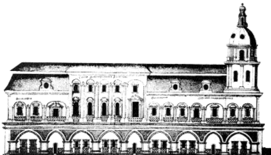
Τὸ κτήριο τῆς Ἀκαδημίας τοῦ Κιέβου. Κτίστηκε τὸ 1703-1704 καὶ ἀνακαινίστηκε μὲ προ- σθήκες μεταξύ τῶν ἐτῶν 1732-1740. Χαλκογραφία τοῦ ἔτους 1760.

“Ὅταν γυρίσαμε στὸ σπίτι μας στὴν Πολτάβα, ὕστερα ἀπὸ λίγο και- ρὸ, χωρὶς καθυστέρηση μὲ ἔστειλε στὸ Κίεβο χάρι τῶν σπουδῶν, στὴν τριετὴ διάρκεια τῶν ὁποίων μὲ προθυμία ἔμαθα τὴ γραμματικὴ, καὶ κάθε καλοκαίρι, σύμφωνα μὲ τὴ σχολικὴ συνήθεια, τὸν μῆνα Ἰούλιο ἔφευγα στὸ σπίτι μας, στὴ μητέρα μου καὶ ἔμενα ἐκεῖ γιὰ δύο ὀλόκληρους μῆνες.” Ἐχο- ντας ἀπόλυτη ἐλευθερία, δὲν ἀσχολούμουν μὲ τίποτε ἄλλο παρὰ μὲ τὴν ἀνάγνωση τῶν ἱερῶν βιβλίων, ἀπὸ τὴν ὁποία ὅλο καὶ περισσότερο βεβαι- ωνόμουν γιὰ τὴν ἀμετάβλητη πρόθεσή μου νὰ γίνω μοναχός. Ἐπίσης κα- τανόησα τελείως ὅτι χωρὶς καλὰ ἔργα, δηλαδὴ χωρὶς τὴν ἀκριβὴ τήρηση τῶν ἐντολῶν τοῦ Χριστοῦ, μὲ μόνη τὴν ὀρθόδοξη πίστη, εἶναι ἀδύνατο νὰ σωθεῖ κανεὶς. Καὶ τότε ἔβαλα μέσα στὴν ψυχὴ μου τέτοια ὑπόσχεση: μὲ τὴ βοήθεια τῆς χάριτος τοῦ Θεοῦ, νὰ μὴν κατακρίνω τὸν πλησίον μου, καὶ ἂν ἀκόμη μὲ τὰ ἴδια μου τὰ μάτια τὸν ἔβλεπα νὰ ἀμαρτάνει, γνωρίζοντας καλὰ ὅτι ἓνας μόνος ὑπάρχει δίκαιος καὶ ἀληθινὸς κριτὴς ζωντανῶν καὶ νεκρῶν, ὁ ἀληθινὸς Θεὸς ἡμῶν ὁ Χριστὸς, ὁ ὁποῖος θὰ ἀποδώσει στὸν κα- θένα κατὰ τὰ ἔργα του. Αὐτὸς ποὺ κατακρίνει τὸν πλησίον του ἰδιοποι- εῖται γιὰ τὸν ἑαυτὸ του τὸ θεῖο τοῦτο ἀξίωμα, καὶ γίνεται ὁ ἴδιος κριτὴς ζωντανῶν καὶ νεκρῶν· τί ὑπάρχει τρομερότερο ἀπὸ αὐτό; Ἀκόμη ὑπο-