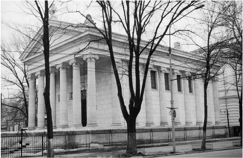
Εικ. 5. Ευαγγελισμός της Θεοτόκου Βουκουρεστίου. Νοτιοδυτική όψη. Fig. 5. Buna Vestire din București. Vedere sud-vestică.

τόσο σημαντική κοινότητα. Ο ίδιος, μάλιστα, στη συνέλευση της κοινότητας που συγκάλεσε στις 12 Δεκεμβρίου 1890, ανακοίνωσε στους παρόντες ότι είχε βρει ως δωρητή έναν Έλληνα τραπεζίτη της Ρουμανίας —, ο οποίος επιθυμούσε να διατηρήσει προς το παρόν την ανωνυμία του και ήθελε να ξεκινήσει την κατασκευή του ναού την επόμενη άνοιξη, όταν θα βελτιωνόταν ο καιρός 14 . Σύμφωνα με τα αρχεία του Υπουργείου Εξωτερικών της Ελλάδας, προκύπτει ότι ο δωρητής αυτός ήταν ο τραπεζίτης Χριστόφης Ζερλέντης 15 .