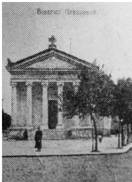
Εικ. 1. Ευαγγελισμός της Θεοτόκου Βουκουρεστίου. Πρόσοψη (παλιά φωτογραφία). Fig. 1. Buna Vestire din București. Fațadă (fotografie veche).