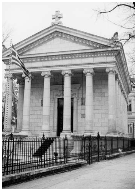
Εικ. 2. Ευαγγελισμός της Θεοτόκου Βουκουρεστίου. Πρόσοψη. Fig. 2. Buna Vestire din București. Fațadă.

la 10 Septembrie 1889, când s-a făcut sfințirea de către Arhiepiscopul Calistrat, ce a așezat piatra de temelie 12 .