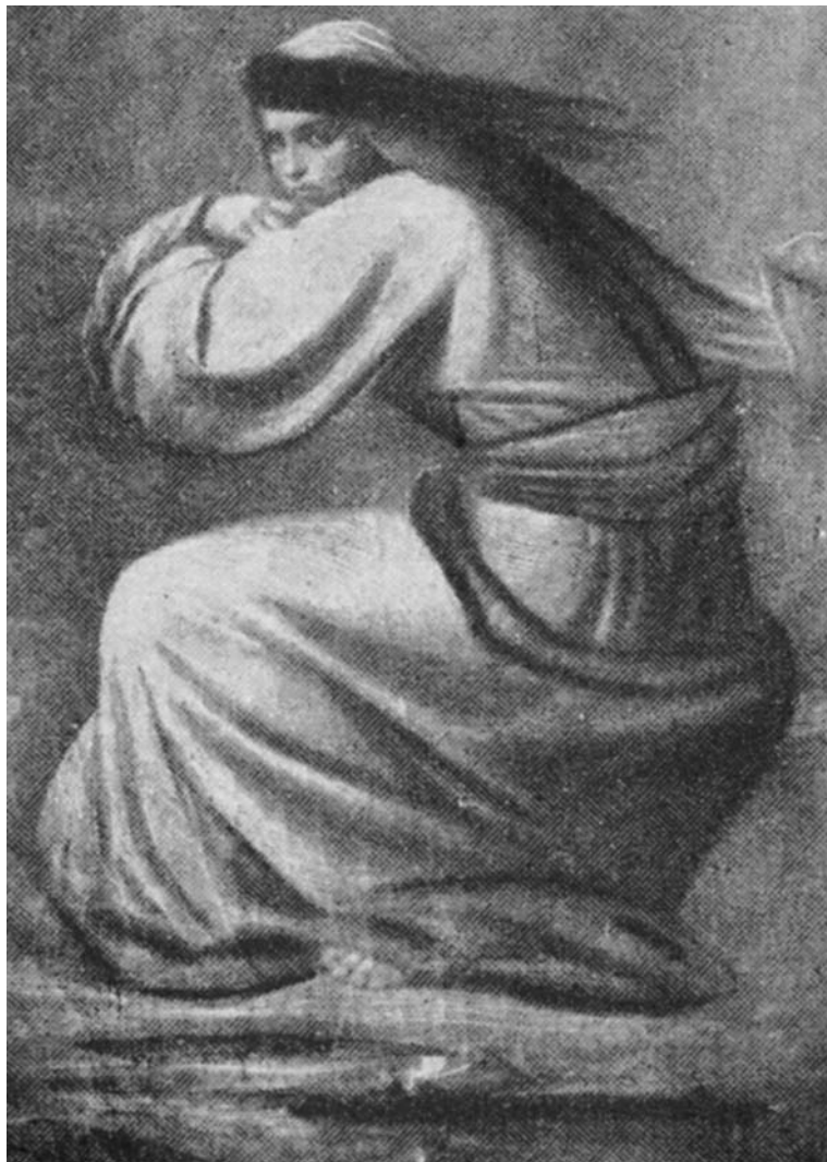
«Η άπελπισία» (ελαιογραφία).

ξέφυγε από την προσοχή του Καπετάνιου πατέρα της. Θα την στείλει αρχικά στο Ναύπλιο, που ήταν τότε πρωτεύουσα, μαζί με τις δύο αδελφές της στο Γαλλικό Σχολείο, κι αργότερα στην Αθήνα, στο Παρθεναγωγείο της Φανής Χίλλ. Ήθελε να μορφώσει τις