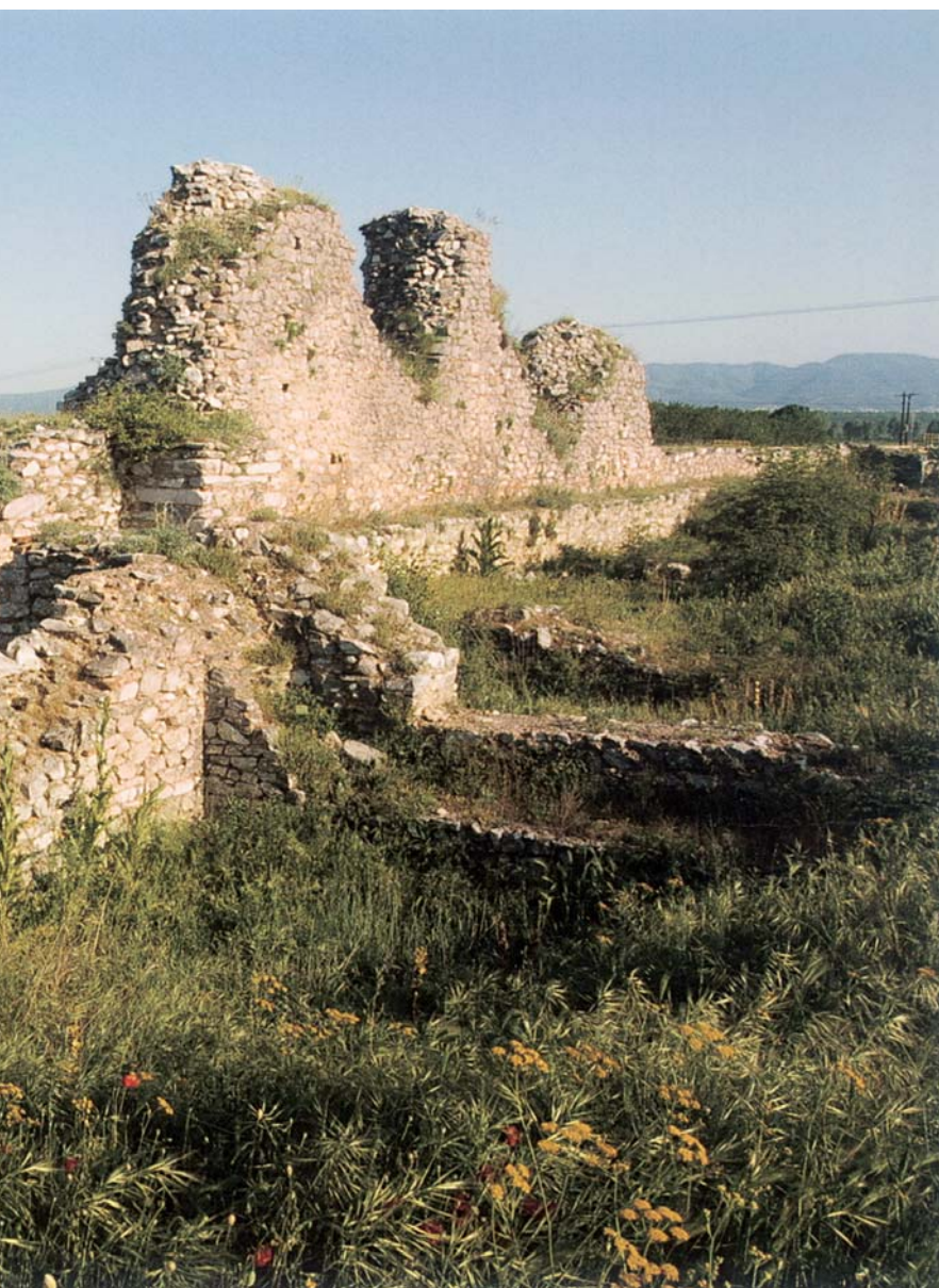
Εικ. 8. Φίλιπποι, Η ανατολική πύλη.

Τρεις είναι οι γνωστές πύλες του τείχους. Πρόκειται για εκείνες που είναι στην ίδια θέση τόσο στην ελληνοιστική όσο και στη βυζαντινή περίοδο, κατά την οποία δεν άλλαξαν μορφή, παρά μόνο υπέστησαν κάποιες επισκευές. Η ανατολική πύλη, ή αλλιώς πύλη της Νεαπόλεως (Εικ. 8), βρίσκεται περίπου στο μέσο του κάτω από το θέατρο περιβόλου και είναι ορατή δίπλα στον οδικό