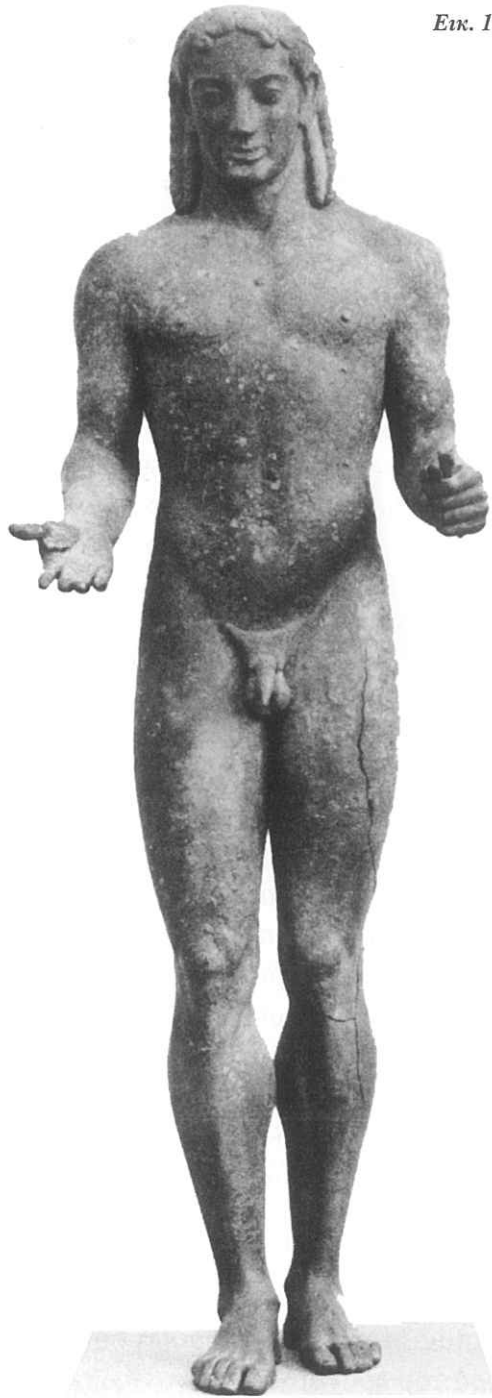
Εικ. 1. Ο Κούρος του Πειραιά, (Απόλλων).