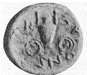
4. Νόμισμα της Κορινθίας (Θεσσαλία) που εικονίζει άμαξα με αγγείο. Γύρω στο 300 π.Χ.

Τα προϊστορικά ευρήματα μας δείχνουν ότι δεν πρέπει να σχηματίσουμε για τον βωμό τέφρας την εντύπωση ενός χαλαρού σωρού στάχτης. Οι βωμοί αυτού του τύπου αποτελούνται από ασβεστοποιημένα μικρά κομμάτια οστών ζώων που με τον καιρό γίνονται πολύ σκληρά (Knochenschotter). Γι' αυτό μπορούσε κανείς, όπως διηγείται ο Πausanias, να ανεβεί με σκαλοπάτια σκαλισμένα στην τέφρα του βωμού της