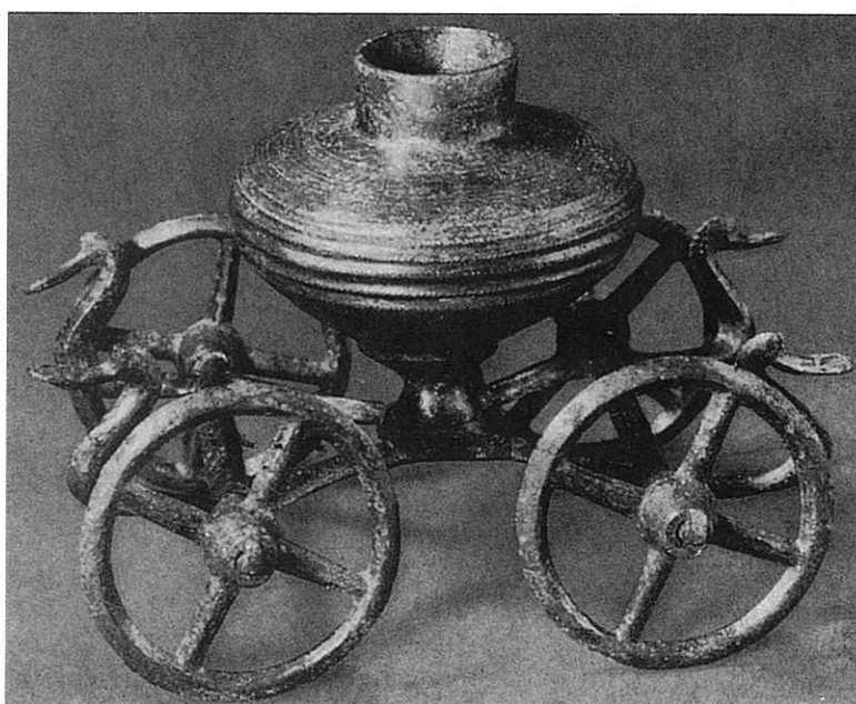
5. Χάλκινη άμαξα με αγγείο από το Acholshausen. Περιοχή του Ochsenfurt. Γύρω στο 1000 π.Χ. Würzburg. Mainfränkisches Museum